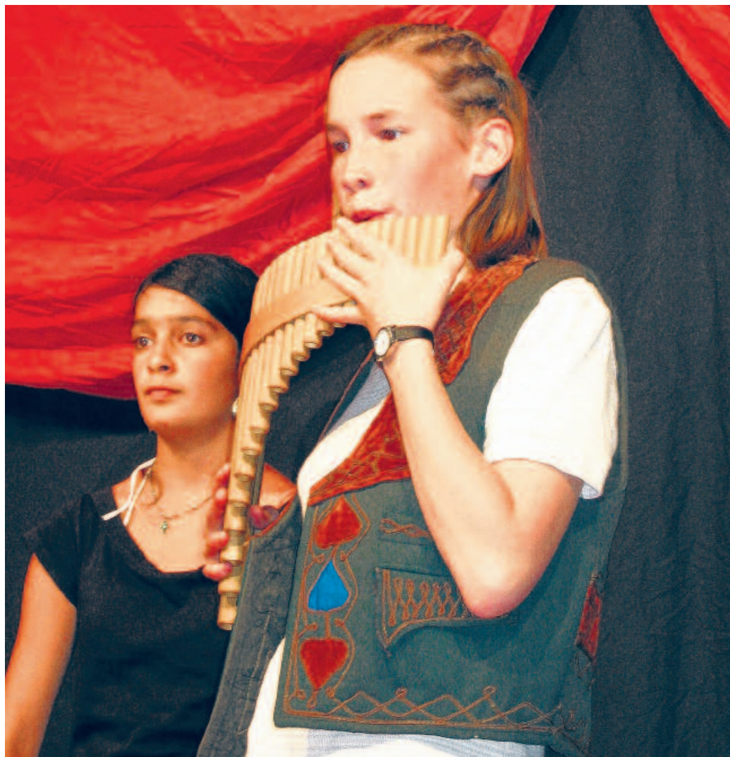
Gemeinsam zusammengestellt, arrangiert und präsentiert (ohne Verstärkung, ohne Noten): Die Pilotklasse des «Schwerpunkts Musik» in Köniz bei ihrer Show.

In der anderen Doppellektion arbeiten alle (7.-9. Klasse) gemeinsam: Stimmbildung und mehrstimmiges Singen, Perkussionsworkshop oder Improvisation sind hier Themen, die Einblicke in ein breites Spektrum musikalischen Tuns geben. Dazu kommen Projekte, die wie das oben Erwähnte auf die Bühne gehen. In diesem Gefäss unterrichten Lehrkräfte, die auf das je-