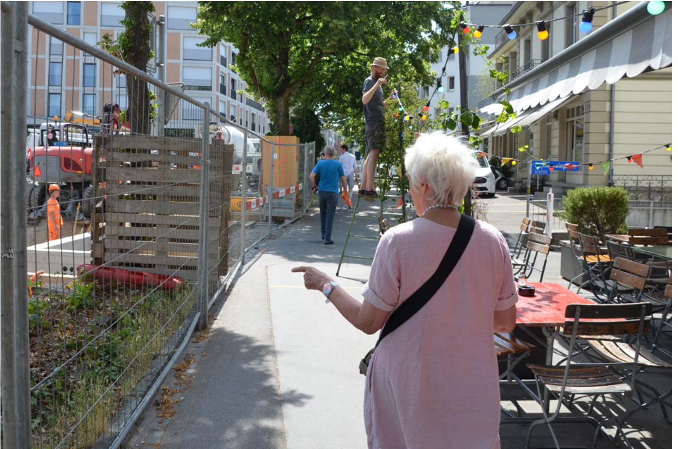
In meinen Augen: Wie ältere Menschen ihr Quartier wahrnehmen