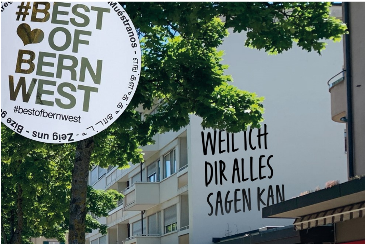
Best of Bern West: Ein Wanderpokal für Komplimente