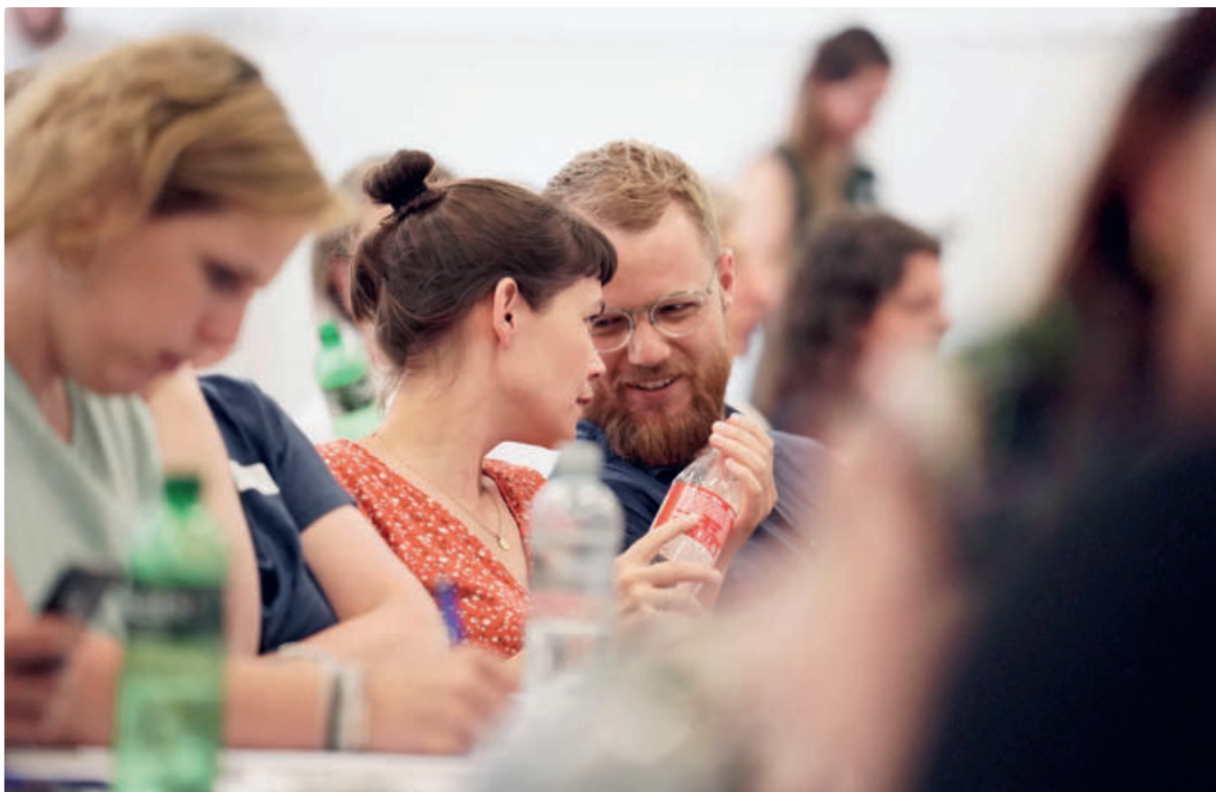
Auch das bietet die Praxistagung: Gelegenheit zum Austausch.