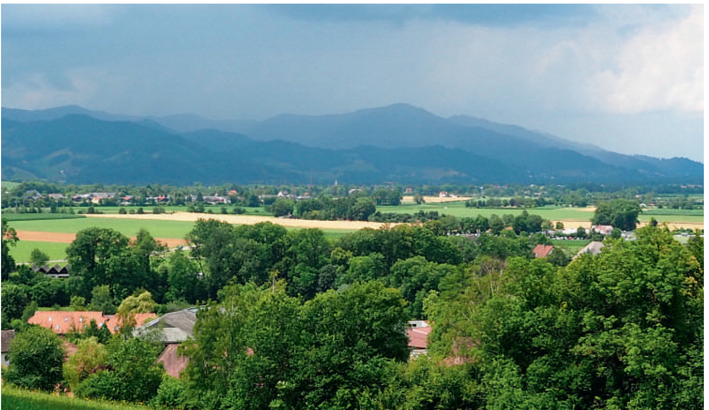
In der dörflichen Gemeinschaft funktioniert die gegenseitige Unterstützung häufig noch.