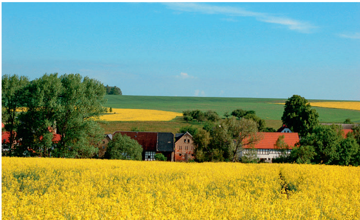
Tiefe Sozialhilfequote trotz tiefem Durchschnittseinkommen ist in ländlichen Gemeinden kein Widerspruch.