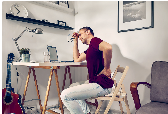
Der interprofessionelle Gesundheitspfad PrePaC zeigt erste positive Effekte: Frühzeitige, personzentrierte Beratung kann das Risiko einer Schmerzchronifizierung senken.

Das Modell des PrePaC-Pfades ist nicht nur auf Schmerzkrankungen beschränkt. Winteler sieht Potenzial, Elemente wie das frühzeitige Screening, interprofessionelle