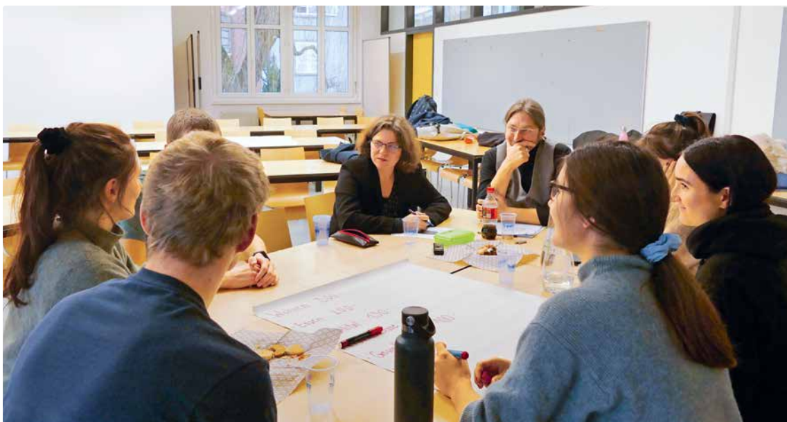
Engagiertes Diskutieren im Bachelor-Modul «Armut»