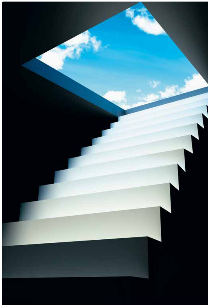
Neue Wege erkennen dank der Laufbahnberatung.

Erfolgreich genutzt wird in der Stadt Bern bereits die Möglichkeit der Weiterarbeit nach dem ordentlichen