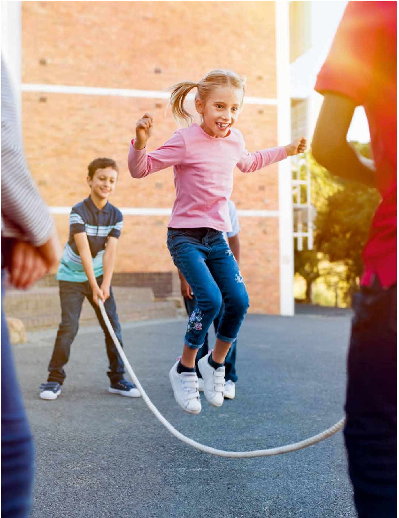
In Tagesschulen stärken Kinder ihr Sozialverhalten.