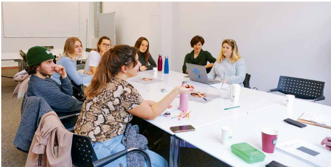
Worauf sollen die Ärmsten nicht verzichten müssen?

Eine Methode, welche sich besonders gut als Instrument zur Festlegung des Grundbedarfs eignet, ist die Durchführung von Fokusgruppengesprächen – das sogenannte Consensual Budgeting (Bradshaw et al. 2008, Collins et al. 2012, Davis et al. 2017, Hoff et al. 2010). Hier bestimmen «normale» Bürgerinnen und Bürger in