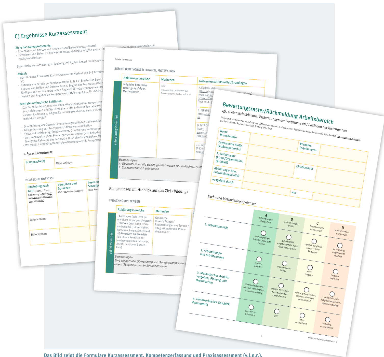
Das Bild zeigt die Formulare Kurzassessment, Kompetenzerfassung und Praxisassessment (v.l.n.r.).