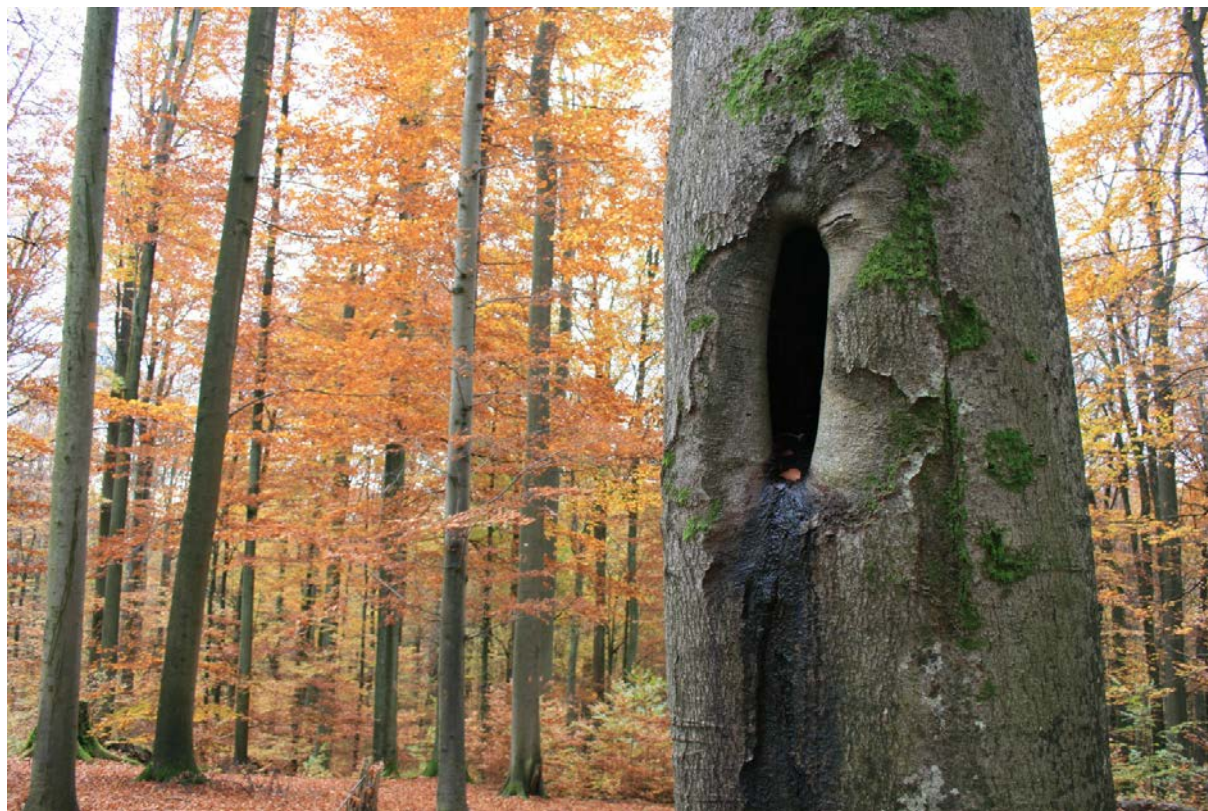
Fig. 1: De nombreuses espèces saproxyliques menacées vivent dans de grandes cavités à terreau. Le maintien de vieux et gros arbres portant ou susceptibles de développer de tels habitats est donc indispensable pour la conservation de ces espèces.

Les quantités de bois mort nécessaires au maintien de la plupart des espèces saproxyliques oscillent en fonction des types de forêts entre 20 et 50 m 3 /ha (Müller et Büttler, 2010) (fig. 2). Même si ces seuils écologiques ne sont pas encore atteints sur le Plateau ou dans le Jura, les tendances de ces dernières années sont encourageantes. Il faut cependant préciser que les espèces exigeantes du point de vue écologique nécessitent des quantités de bois mort bien supérieures à ces seuils. Par conséquent, ces espèces ne peuvent pas survivre en forêt exploitée, même si la gestion est proche de la nature. En effet, certaines espèces saproxyliques requièrent des quantités de bois mort supérieures à 100 m 3 /ha ou encore des arbres morts de grande dimension. En Suisse, de telles quantités et qualités de bois mort se retrouvent uniquement dans les forêts n'ayant plus été exploitées depuis plusieurs décennies (réserves forestières, accès difficile, mauvaise rentabilité) ou sur des chablis. Afin de maintenir les espèces exigeantes et par conséquent souvent les plus menacées, le maintien de forêts non exploitées sur le long terme est indispensable. Les réserves forestières naturelles jouent donc un rôle indispensable pour leur conservation.