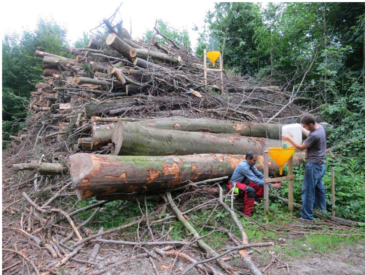
Fig. 3: Les dépôts de bois-énergie agissent comme des pièges écologiques. Ils attirent de nombreuses espèces saproxyliques, dont certaines sont menacées, mais ne permettent pas leur développement. Cet effet est étudié par le WSL.

Dans le cadre de la chaîne d'approvisionnement directe, les dépôts de bois-énergie destinés à la fabrication de plaquettes restent en forêt durant l'été pour sécher (fig. 3). Ces dépôts attirent de nombreux insectes saproxyliques, qui y trouvent des sites propices à la ponte. Cependant, comme le bois ne tarde pas à être déchiqueté, les larves de la plupart des espèces ne parviennent pas au terme de leur développement (Lachat et al. , 2014b). L'impact à long terme de ces «pièges écologiques» sur les coléoptères saproxyliques est encore inconnu.