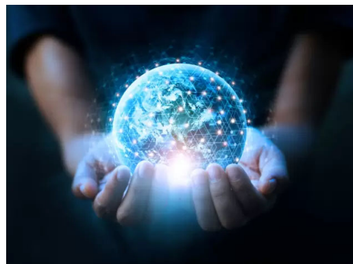
«Wir sind alle mit dem Phänomen Datenkolonialismus verbunden»