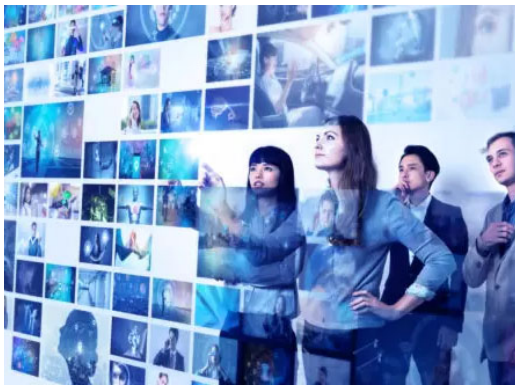
Datenzentrierte Unternehmen - Wo Revolutionen zusammenlaufen