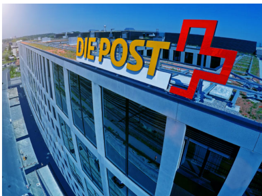
«Wir müssen den Service public digital denken»