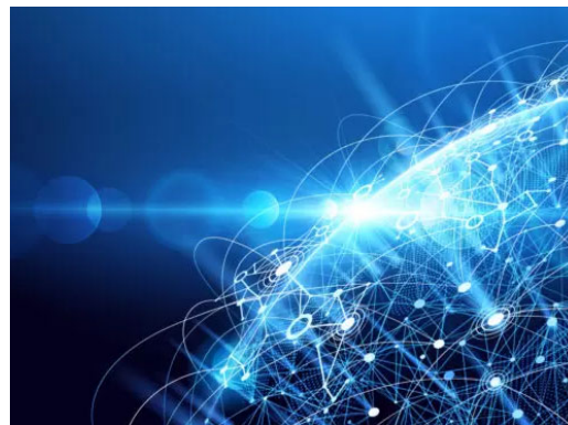
«Open by default» als Gesetz