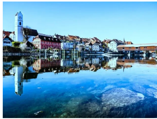
Resiliente Gemeinden dank Partizipation, Digitalisierung und nachhaltiger Strategie