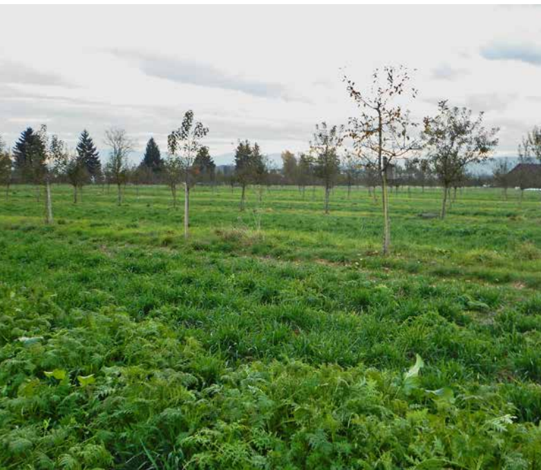
Abb. 1 | Die untersuchte Agroforstparzelle in der Zentralschweiz mit 545 Apfelbäumen und Gründung in der kultivierten Fläche hat bereits nach sieben Jahren relevante Mengen Kohlenstoff und Stickstoff im Ober- und im Unterboden angereichert.

Auskünfte: Benjamin Seitz, E-Mail: benjamin.seitz@agroscope.admin.ch