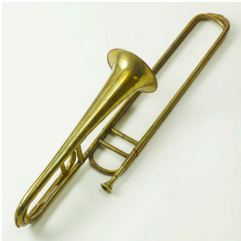
Abb. 2: Bassposaune in Es mit Doppelzug, Anonym, um 1825, Klingendes Museum Bern, Inv. Nr. 1226.

Folgende Instrumente der überlieferten Rorschacher Besetzung sind demzufolge nicht erhalten: Terzflöte, Klarinetten (laut Besetzungsliste im Posaunenbuch waren es neun), zwei Naturtrompeten, Serpent und zwei kleine Trommeln.