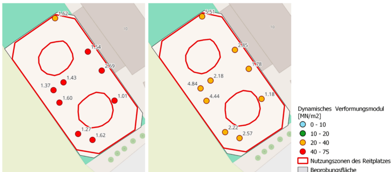
Abb. 1: Räumliche Variationen der sportphysiologischen Eigenschaften auf dem Reitplatz site 2 in Woche 4 (links) im Vergleich zu Woche 7 (rechts). Rote Linien bezeichnen die Nutzungszonen des Reitplatzes, graue Fläche: Probenahmen zufällig ausgewählt

vollständige Auswertung der Setzungskurven einschliesslich der Rückprallgeschwindigkeit der Fallplatte des leichten Fallgewichtes eine objektive Methode zur Beschreibung der Reaktivität einer Reitplatzoberfläche darstellen könnte.