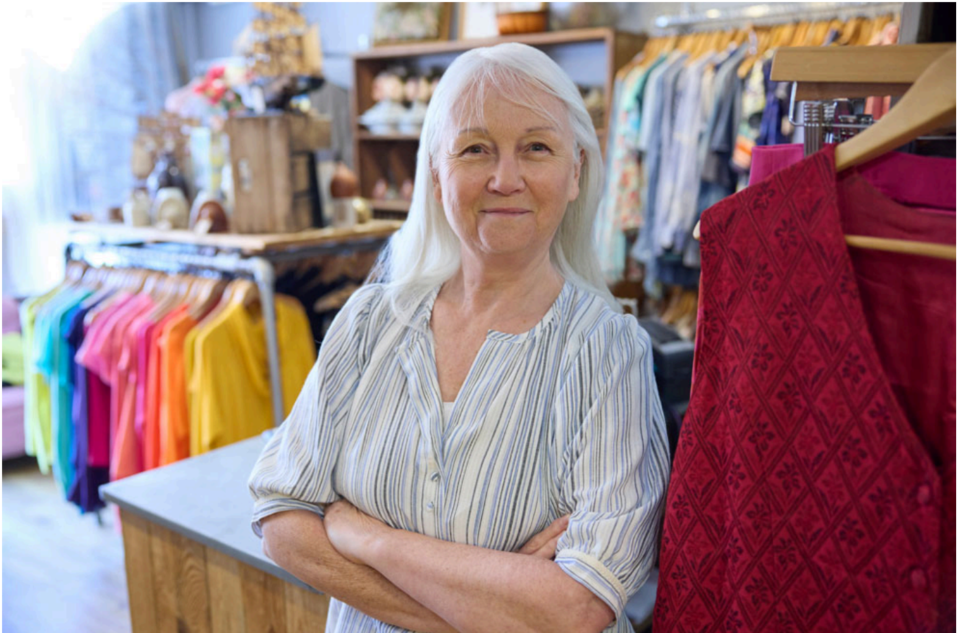
Arbeit nach 65: «Ja, gerne» oder «Nein, danke»?