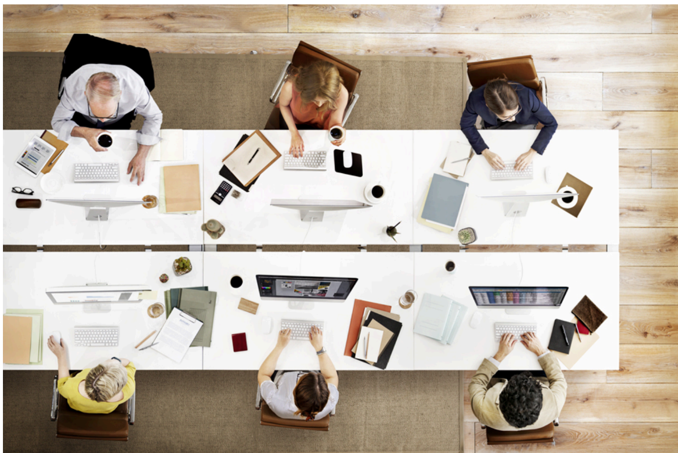
Die Generation 50+ in der Arbeitswelt 4.0