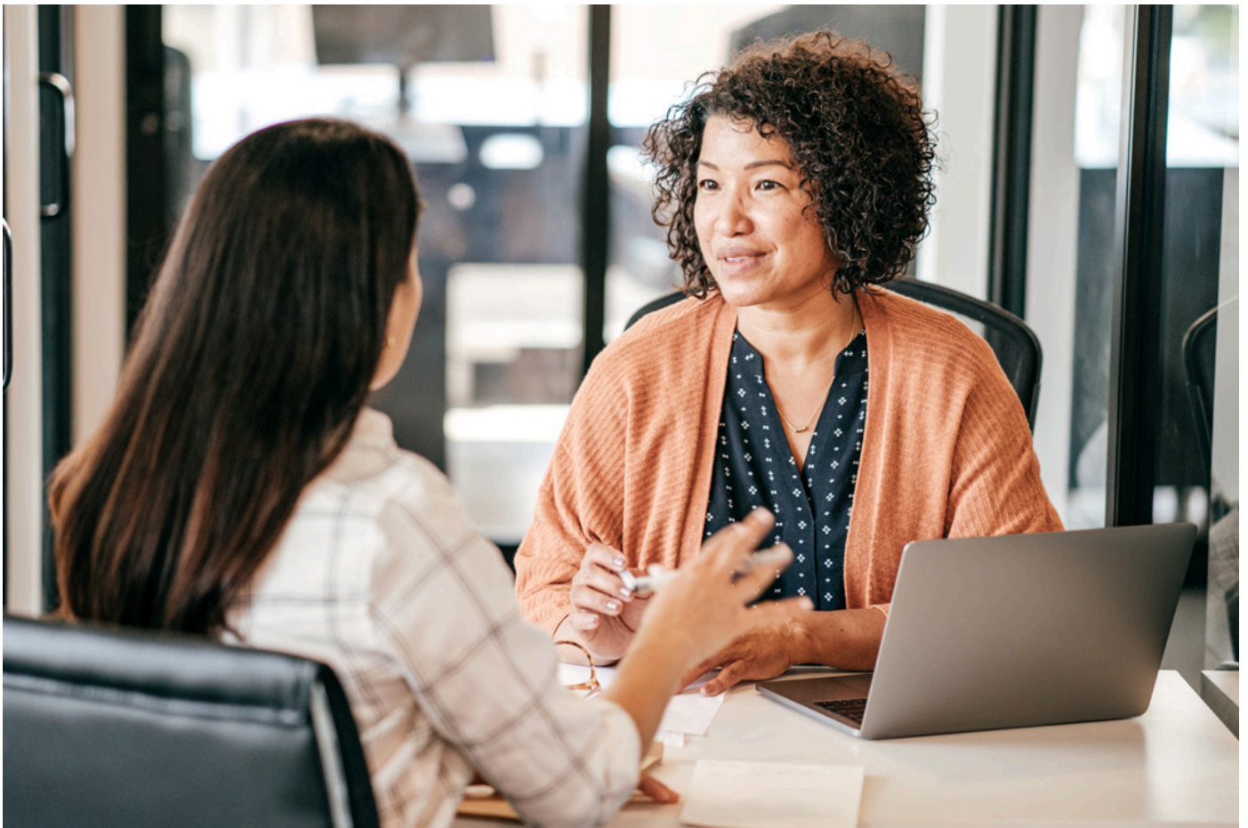
Mitarbeitende 45+ sind ein wichtiger Teil der Diversität