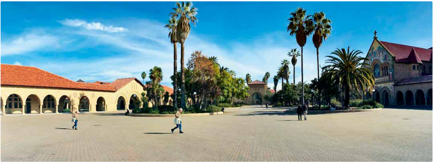
Campus der Stanford University in San Francisco

Ausgangspunkt für die elf Forschungsagenden sind entsprechende soziale Problemlagen. Anschliessend wird beschrieben, welche gesellschaftlichen Fortschritte durch eine erfolgreiche Bearbeitung der Problemstellungen erzielt werden könnten. Auf der Basis des aktuellen Forschungsstandes werden forschungsgestützte Innovationen entwickelt, die helfen sollen, die avisierten Ziele zu erreichen. Einen guten Überblick über die Forschung in Sozialer Arbeit in den USA bietet der Jahreskongress der Society of Social Work and Research (SSWR), welcher jährlich im Januar stattfindet (SSWR, 2017).