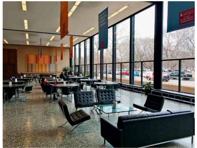
Eingangsbereich der von Mies van der Rohe entworfenen School of Social Service Administration der University of Chicago

Praxishilfen sowie Hinweise auf berufliche Entwicklungsmöglichkeiten und politische Entwicklungen zur Verfügung (NASW 2017b).