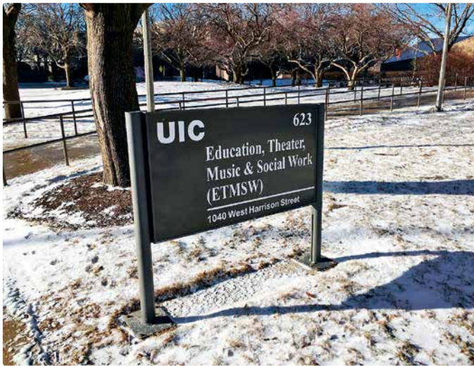
Auf dem Gelände der University of Illinois at Chicago