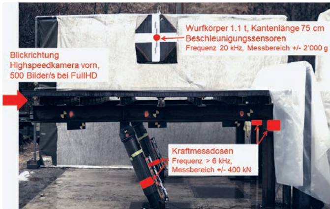
Abb. 2: Seitenansicht Versuchsaufbau und Messtechnik

Lawinverbauungen stehen in alpinem Gelände mit sensibler Flora und Fauna. Die Baustelleneinrichtung und die Baumaterialien werden üblicherweise mit dem Helikopter in die Steilhänge transportiert. Lärm und CO 2 -Ausstoss dieser Transportflüge belasten die Umwelt und die Tierwelt stark. Die neu entwickelte Lawinverbauung bedingt weniger Helikoptertransporte und schont die Umwelt.