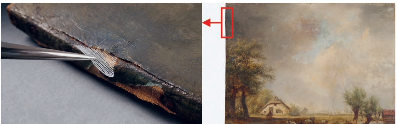
Abb. 1: Ein Leinwandgemälde (rechts) wurde vormals durch ein zweites Gewebe hinterklebt. Die Verklebung löst sich entlang der Ränder. Klebstoffgitter werden zwischen die zwei Leinwände geschoben (links) und dort mit wenig Wasser aktiviert.

An mehreren Leinwandgemälden konnte diese Technik bereits erfolgreich eingesetzt werden. Für gute Ergebnisse müssen sich die Dimensionen der Gitter im Bereich von ein paar wenigen Hundert Mikrometern bewegen. Als Geometrie werden derzeit quadratische Gitterstrukturen verwendet, die durch hexagonale Strukturen abgelöst werden sollen, die sich herstellungs- und anwendungstechnisch als vorteilhaft her-