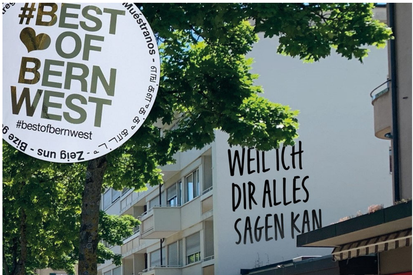
Best of Bern West: Ein Wanderpokal für Komplimente