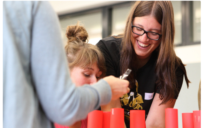
Die Studierenden verbringen bei Studienbeginn einen halben Tag im «DC».

Eine wichtige Unterstützungsfunktion übernehmen ausserdem die Coaches. Mit regelmässigen Rückmel-