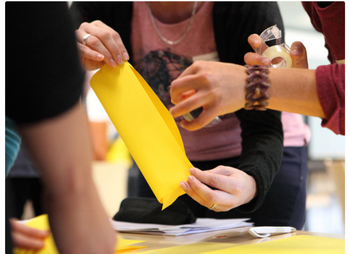
Im Development Center: Studierende lösen gemeinsam eine Aufgabe und erhalten Feedback zu ihren Sozialkompetenzen.

Die Frage, wie die über einen längeren Zeitraum geführte Portfolioarbeit für die Studierenden interessant und abwechslungsreich angeleitet werden kann, wird uns weiterhin beschäftigen.