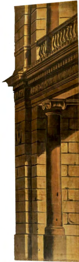
Abb. 2: Seitenkulisse aus dem Theater Feltre einen Platz («piazza») darstellend

die Zahl an Kulissen in vielen Theatern reduziert. Die Kulissenbühne stellt also ein poröses On dar, in das von allen Seiten eingedrungen werden kann. Erst in ihren letzten Lebensjahrzehnten werden diese Zugänge begrenzt, 43 während andererseits auf der Bühne immer stärker das Zeremoniell der Auftritte und Abgänge verletzt wird und Unbefugte (wie Volksmassen) in Räume Mächtiger eindringen können. 44