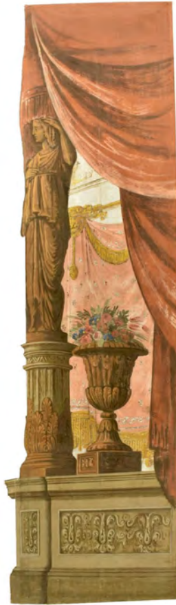
Abb. 1: Seitenkulisse aus dem Theater Feltre eine Kammer (»gabinetto«) darstellend

Der A-vista-Szenenwechsel bleibt im Italien des 19. Jahrhundert wichtiger Bestandteil von Theateraufführungen und kann als Paradigma der Bühnenmaschine gelten: Die Seitenkulissen verfügen über eine in der Unterbühne verborgene Maschinerie, die sie vom angrenzenden Off auf die Bühne befördert, so dass die Illusion eines plötzlichen Szenenwechsels entsteht. Dieser findet vor den Augen des Publikums statt, so dass dessen Technik seinen Augen nie völlig verborgen bleiben kann. Die Kulissenbühne zeichnet sich außerdem dadurch aus, dass sie zahlreiche Zugänge zur Bühne bereitstellt. Es können im Normalfall zwischen allen Seitenkulissen Auftritte und Abgänge stattfinden. Erst ab Ende des 18. Jahrhunderts wird