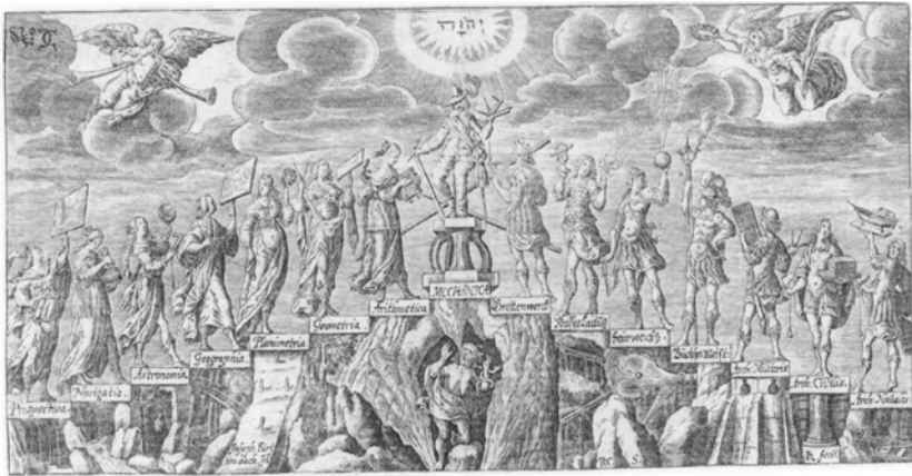
Abb. 1: Joseph Furttentbach, Mechanica und ihre Töchter und Söhne (Frontispiz), Mechani- sche Reißlade . Aus: Furttentbach, Architectura Privata , Augsburg 1641, Math 2° 323/d4 (2)

Unzählige Ordnungen und ebenso viele relative Perspektiven: Raumtheoretisch wird die Wendung zur Vielzahl von Teilansichten und dezentrierten Perspektiven von Leibniz, dem Verfasser der Monadologie , topologisch begriffen: als ein unan- schauliches, in sich selbst ungleichzeitiges räumliches Geflecht. Dieses Geflecht zeitigt Raum, der sich ausdehnt, sich jedoch nicht räumlich-horizontale innerhalb