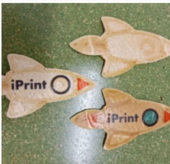
Pfannkuchen-Rakete aus hochkalorischem Teig.

Die Spezialist*innen von iPrint kombinierten verschiedene Technologien, um ein attraktives Resultat zu erhalten: Die Raketen werden zunächst mithilfe der 3D-Druck-Technologie «Direct Ink Writing» auf eine 160 °C erhitzte Platte aufgetragen. Die kleinen Raumfähren werden dann zu einem weiteren Drucker geführt, der sie mit essbarer Tinte verziert. Der Einsatz dieser Technologien würde es erlauben, vollständig personalisierte Pfannkuchen herstellen zu lassen. Die Vision von Balestra: «Die Kinder könnten die Form ihres Snacks auf einem Tablet zeichnen und ihren Namen oder eine Zeichnung auf den Pfannkuchen drucken lassen.»