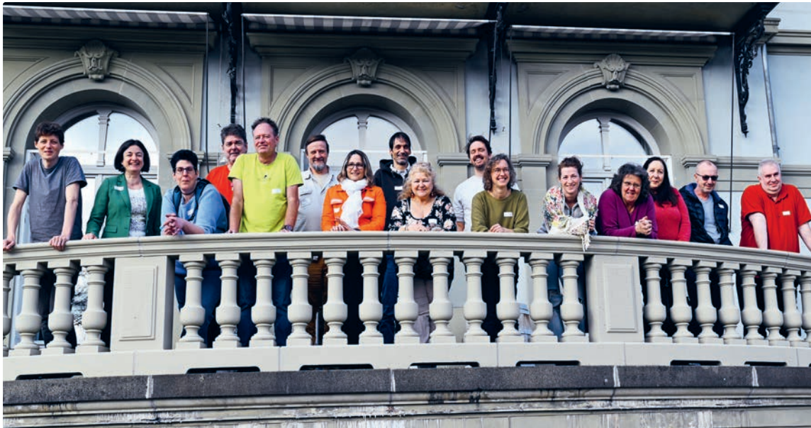
Eine Gruppe engagierter Menschen im Einsatz für den Rat für Armutsfragen.

Erst mit kontinuierlichen Strukturen kann die Beteiligung Armutsbetroffener in der Armutspolitik nachhaltig Wirkung erzielen. Ein BFH-Forschungsteam hat deshalb gemeinsam mit Armutserfahrenen und Fachpersonen für das Bundesamt für Sozialversicherungen einen Vorschlag erarbeitet, um einen Rat für Armutsfragen ins Leben zu rufen.