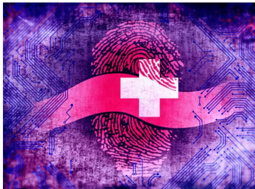
6 Gründe gegen einen zentralen staatlichen Identitätsprovider