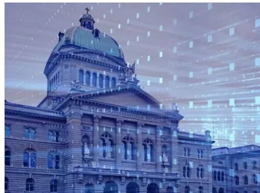
Bund und Kantone beschleunigen die digitale Transformation