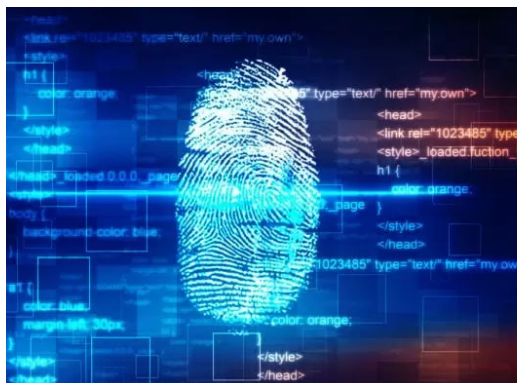
Self-Sovereign Identities: Von der Vision bis heute