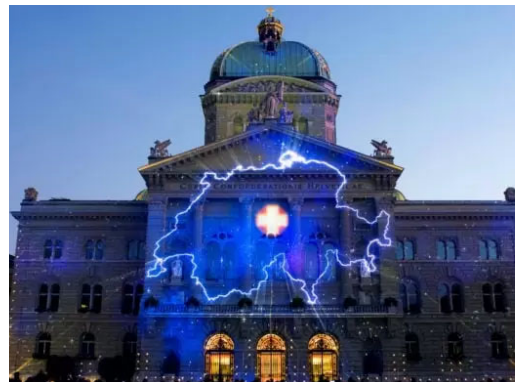
Die Rolle der E-ID für das Digital Government