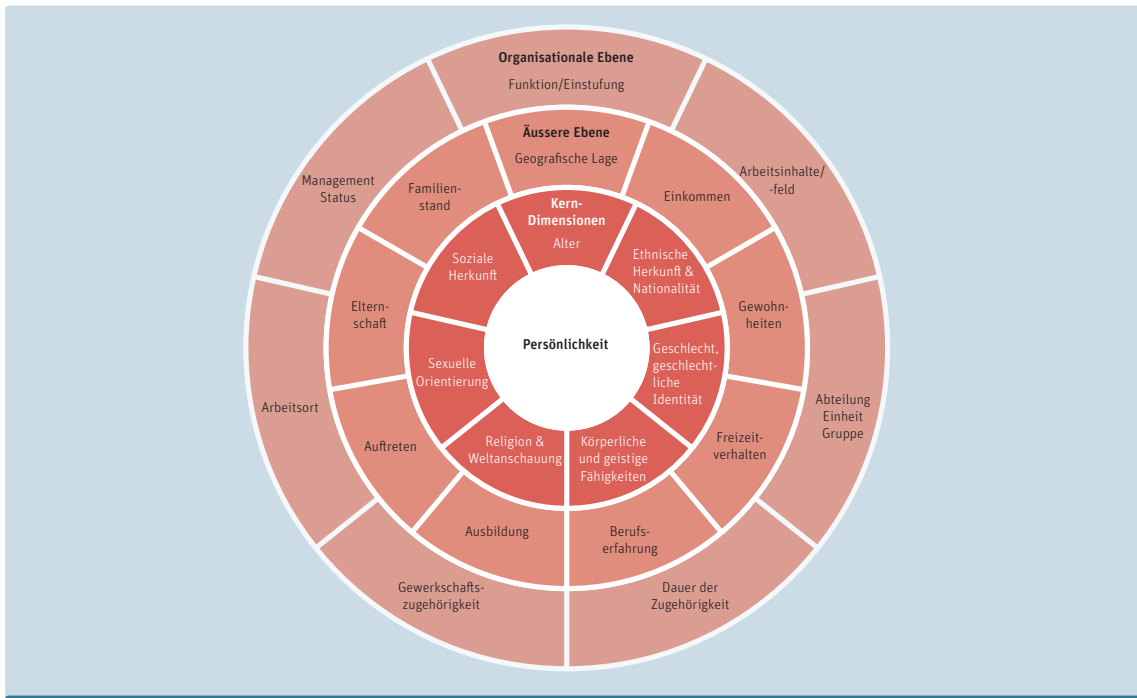
Wenn sich Unternehmen im Sinne von Diversity Management entscheiden, Vielfalt umfassend zu stärken, benötigen sie eine Grundlage. Das vierstufige Modell von Charta der Vielfalt hilft, Unterschiede und Gemeinsamkeiten der Menschen zu erfassen. (Quelle: www.charta-der-vielfalt.de )

Ressourcen und Möglichkeiten zur Folge. Intersektionalität macht dieses komplexe Zusammenspiel beim Entstehen von sozialer Ungleichheit sichtbar und greifbar.