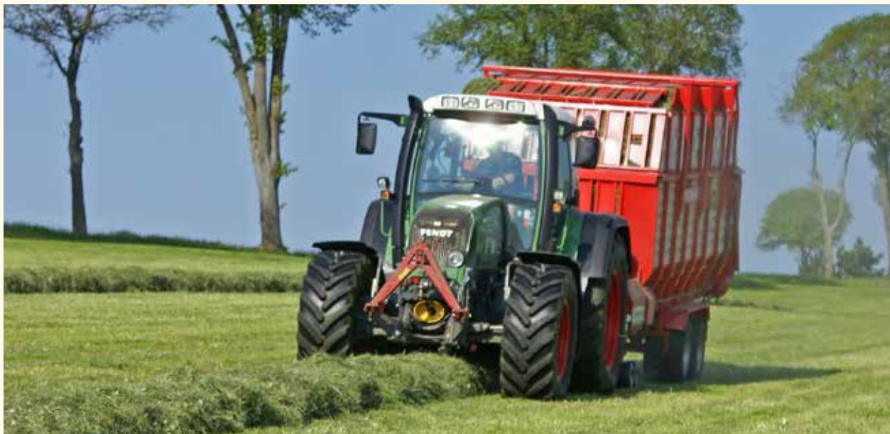
Abb. 1 | Die Kenntnisse und die Erfahrung der Betriebsleiter haben einen grossen Einfluss auf die Qualität der Futterkonserven.

Schweiz die Region und die Höhenlage einen Einfluss auf die Nährstoffe des Dürrfutters, wobei in der zitierten Studie meist in Proben aus der Region Ost-Schweiz höhere Gehalte vorgefunden werden.