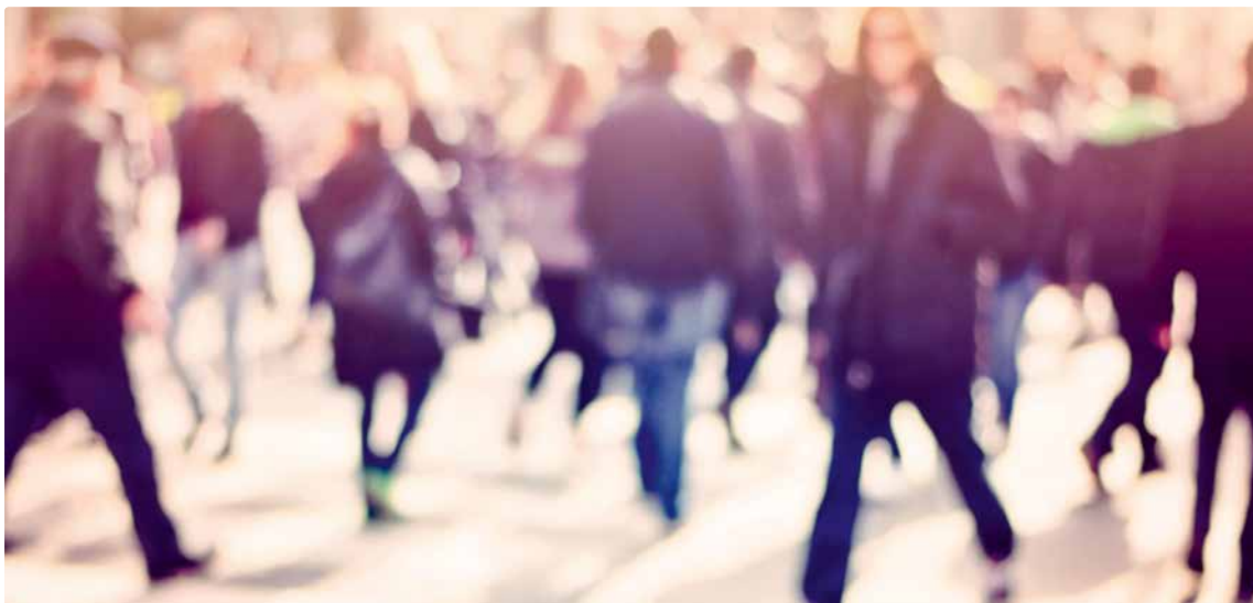
Die Gestaltung der beruflichen Laufbahn beeinflusst die Höhe der Rente.