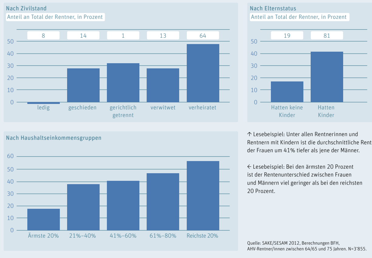
Grafik 2: Gender Pension Gap nach Zivilstand, Elternstatus und Einkommenshöhe, in Prozent

anhand der berücksichtigten soziodemografischen und sozioprofessionellen Faktoren erklärt werden. Das verwendete Modell kann die Rentenunterschiede also relativ gut erklären: Hätten Frauen die gleichen Erwerbseinkommen in den Jahrzehnten vor der Pensionierung, dieselbe Bildung und gleich wenige Erwerbsunterbrüche wie Männer, so würden sie im Mittel eine um 31% höhere Rente erzielen.