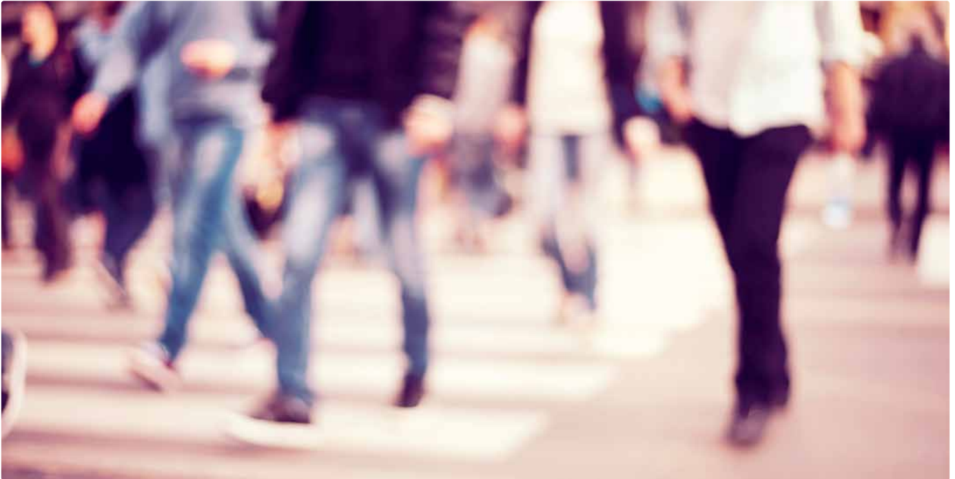
Mit einem Rentenunterschied von 37 Prozent liegt die Schweiz im europäischen Mittelfeld.

den Frauen und 2,6% bei den Männern ist die dritte Säule für die Altersrenten und damit auch für den Gender Pension Gap mehrheitlich unbedeutend. Zentral ist der ungleiche Zugang zu Pensionskassenansprüchen: Nur 54,6% der Frauen, aber 77,6% der Männer haben Ansprüche auf Leistungen aus der beruflichen Vorsorge. 26% der Männer und 14% der Frauen hatten Ersparnisse aus der dritten Säule.