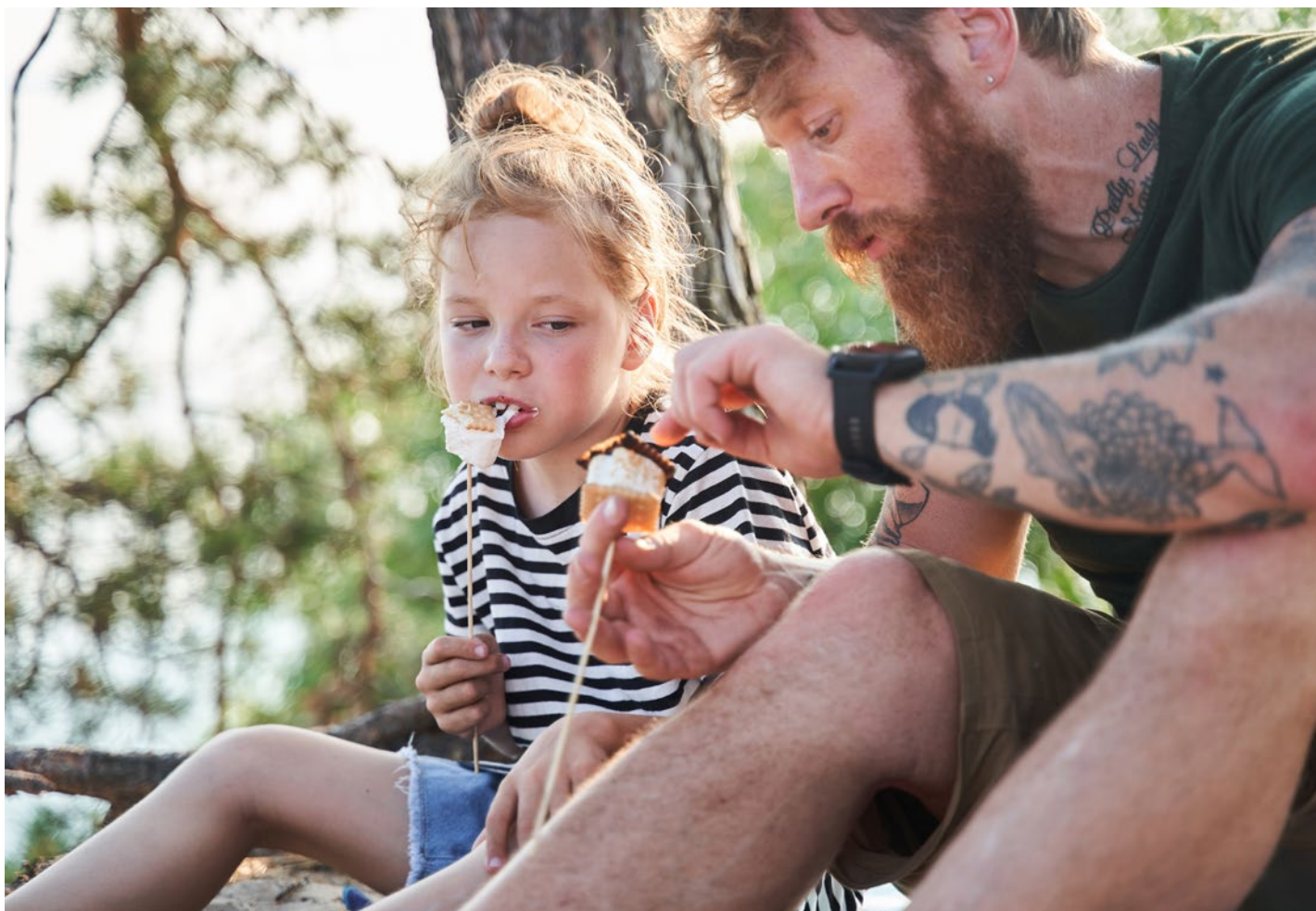
16 Prozent aller Familienhaushalte sind heute Einelternfamilien.

und Familien mit vielen Kindern. Klassische Paarhaushalte mit Kind(ern) fallen darin allerdings nicht auf. Die BFH hat allerdings jüngst die Sozialstruktur der Haushalte in der Zone unmittelbar oberhalb der Armutsgrenze untersucht; in diesem Bereich befinden sich ausserordentlich viele Paarhaushalte mit Kindern. Das heisst, diese Familien gelten gerade nicht als arm, sie sind aber stark armutsgefährdet. Mit nur geringen Einkommensverminderungen oder unerwarteten Auslagen rutschen diese Haushalte unter die Armutsgrenze.