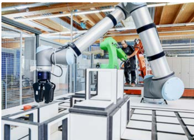
Die Auseinandersetzung mit der Digitalisierung variiert in der Wald- und Holzbranche, ...