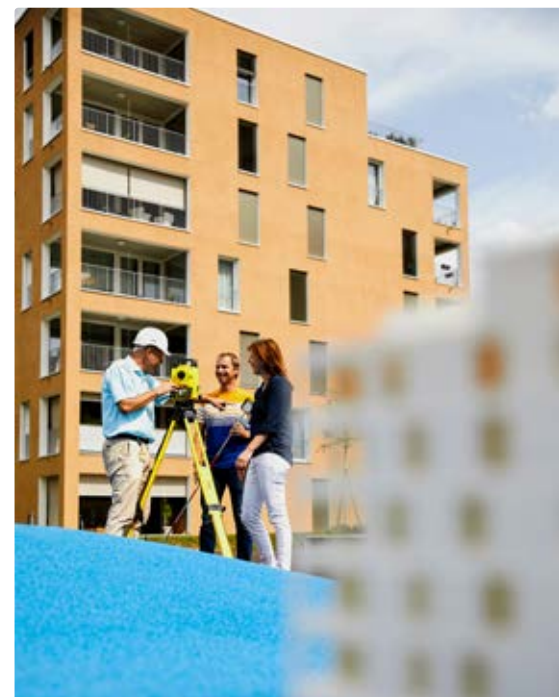
Vom digitalen zum realen Modell.