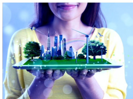
Wie wir alle Stadt nachhaltiger machen können - eine Podcast-Episode über Smart Cities