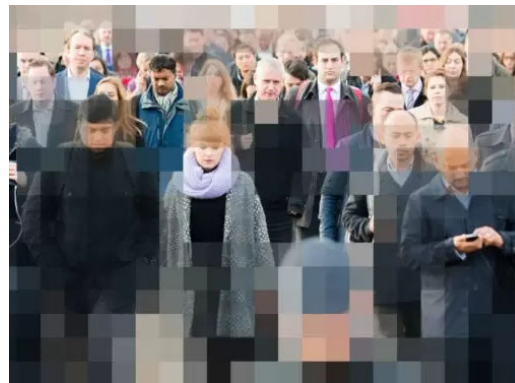
Septemбераusgabe: Ein Ökosystem ist essentiell für die Etablierung von Smart Cities