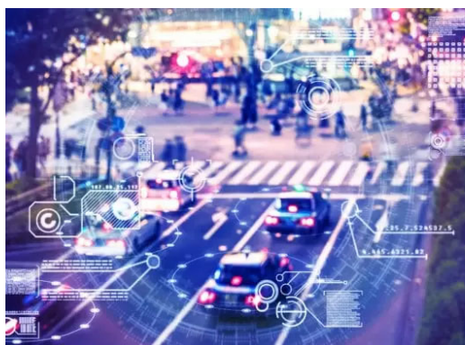
Smartcity-Monitoring der kommunalen Entwicklung