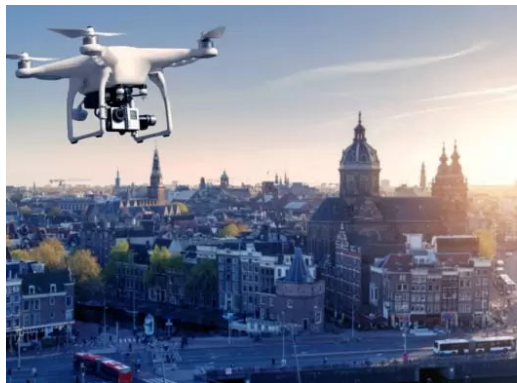
Dateninfrastruktur macht Städte erst smart