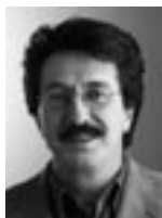
Dr. Urs Kalbermatten Dozent und Leiter Kompetenzzentrum Gerontologie

Diskriminierung richtet sich in der Schweiz nicht nur gegen Minderheiten. Auch ältere Menschen sind betroffen. Wie verbreitet ist die Diskriminierung und welche Formen nimmt sie an? Dem geht ein neues Forschungsprojekt des Fachbereichs auf den Grund, das vom Schweizerischen Nationalfonds unterstützt wird.