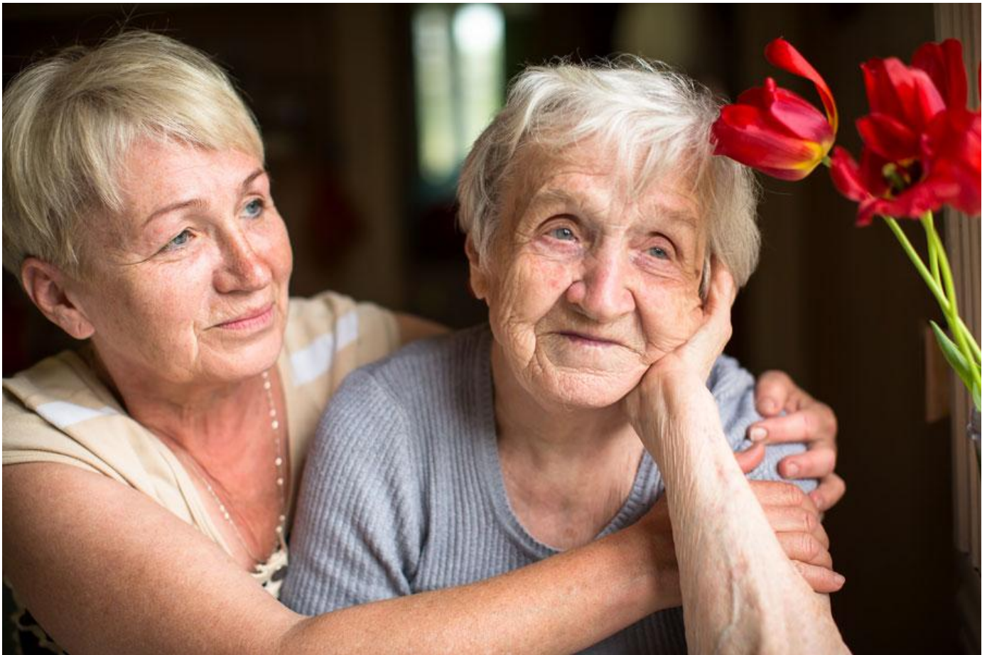
Pflegende Angehörige: Entlastung allein reicht nicht