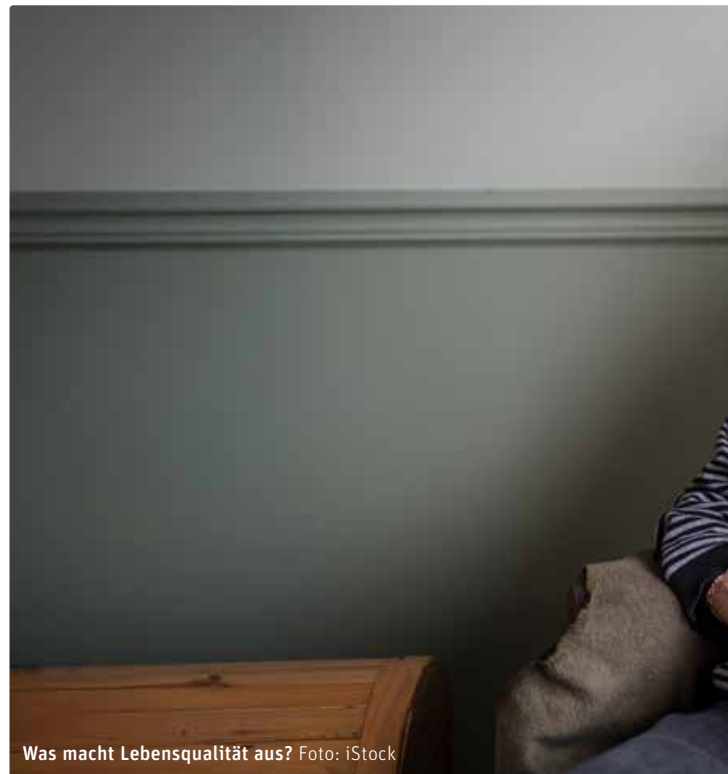
Was macht Lebensqualität aus?

Frau N. lebte jedoch sozial isoliert. Ihre Cousine ist die einzige Person, zu der sie gelegentlich Kontakt hat. Ein stabiles soziales Netz fehlt, was das Risiko für Einsamkeit, Vernachlässigung und psychische Krisen erhöht. Ihre Einweisung in die psychiatrische Klinik erfolgte nach einem Notruf, bei dem auch die Polizei und die Kindes- und Erwachsenenschutzbehörde (KESB) einbezogen