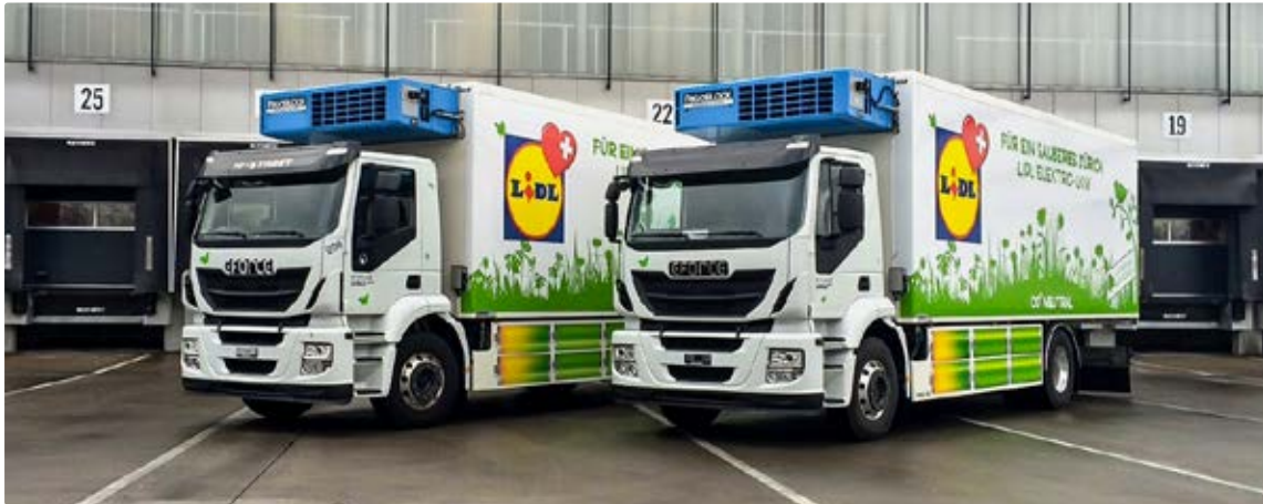
Lidl Schweiz spendet der BFH zwei E-LKW zu Forschungszwecken