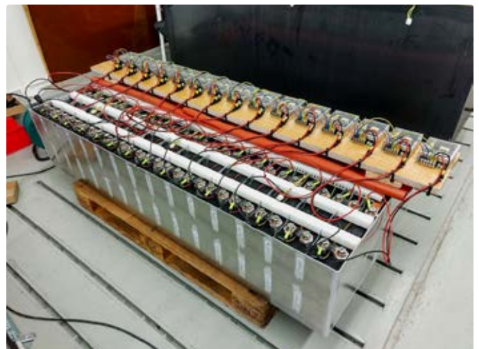
Abbildung 1: Aufbau, um den Ladezustand der einzelnen Zellen eines Teilblocks der E-LKW-Batterie auszugleichen

Aufgrund der Grösse und des Gewichts der Batterien ergaben sich einige Herausforderungen in der Handhabung. Wegen der hohen Spannung von über 400 Volt mussten zudem entsprechende Sicherheitsvorschriften (Handschuhe, Visier) eingehalten werden. Einzelne besonders schlechte Zellen wurden ersetzt durch Zellen aus einer Reservebatterie, welche die E-Force One AG gratis zur Verfügung stellte. Damit verfügt die BFH nun über einen E-LKW mit durchschnittlichen 85% der Anfangskapazität und einen zweiten E-LKW mit einer Kapazität von knapp über 60%, der so allerdings nur noch für Kurzstrecken tauglich sein dürfte.