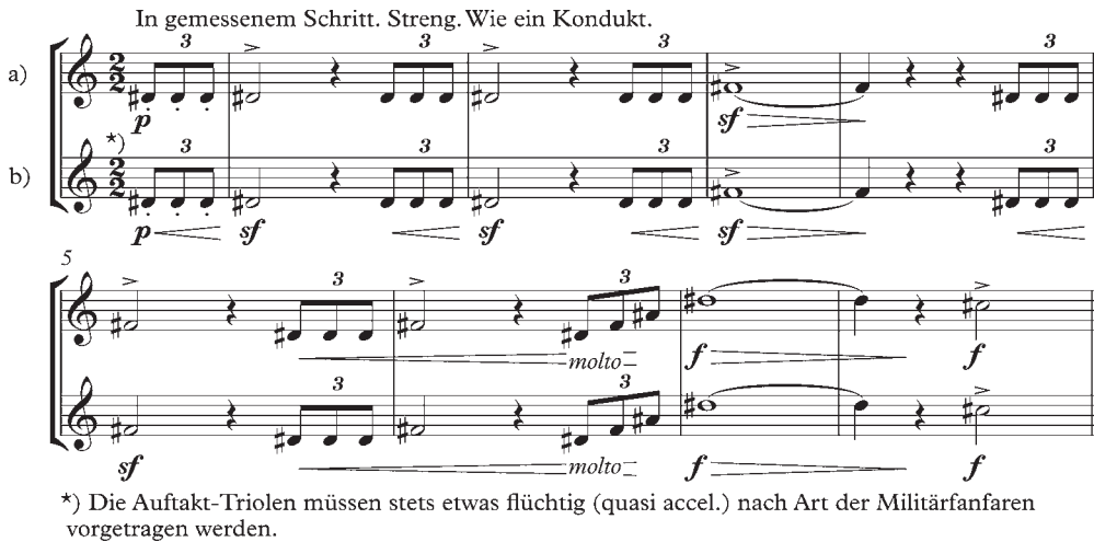
ABBILDUNG 1 Gustav Mahler: 5. Sinfonie, 1. Satz, Synopse der Takte 1–7. a) Druck der Erstausgabe der Studienpartitur, Leipzig 1904 (Plattensnummer 9015; auch diese wurde mit identischer Plattensnummer später angeglichen), S. 3; b) heutige kritisch-wissenschaftliche Ausgaben ab 1964