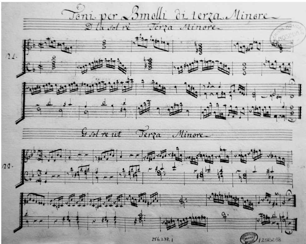
FIGURE 4 Raimondo Mei: Intonazioni ossia Preludij per tutti li toni sul cembalo [...], ms, I-Mc, Nosedà L 16-14