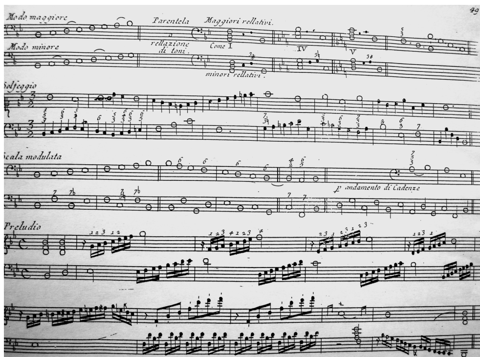
FIGURE 2 Ignazio Michele Pfeiffer: La bambina al cembalo o sia metodo facile e dilettevole in pratica per apprendere a ben suonare, ed accompagnare sopra il clavi-cembalo o forte piano, Venezia [1785], p. 49