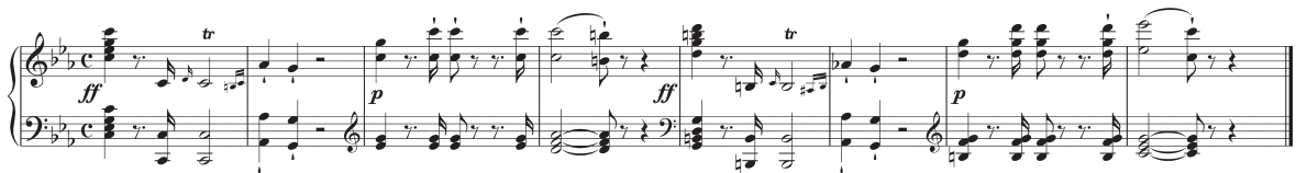
NOTENBEISPIEL 6 Periodische Themengestaltung in Czernys op. 200, Exempel 38a, S. 37

Exempel 38a (Notenbeispiel 6) zeigt diesen Typus und übernimmt die kontrastierende Gestaltung der Segmente wie bereits im ausgehenden 18. Jahrhundert üblich, etwa in Mozarts Sonate c-Moll KV 457 oder der Sinfonie C-Dur KV 551.