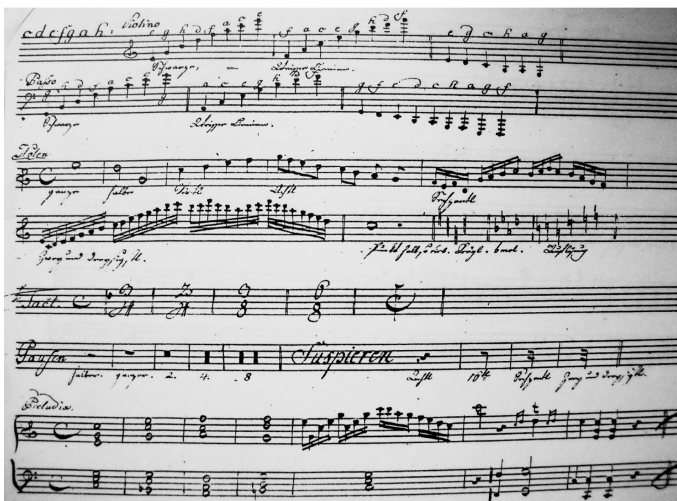
FIGURE 1 Fondamento, ms, I-Mc, Nosedà Z 5-11