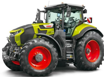
Bild 4: Claas Axion 9: Neue Bezeichnung, neue Kabine, neuer Look, neue Elektronik.

Stufenlosgetriebe mit Hybridkopplung (EQ220), der Boost wird neu aber stufenweise freigegeben. Die bekannte Kabine weist zudem neue Ausstattungsmerkmale auf.