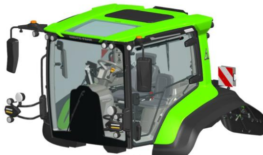
Bild 6: Neue, größere SigmaVision-Kabine für die Serie 8 von Deutz-Fahr

Deutz-Fahr stellte in Hannover die komplett neuen Serie-8-Modelle 8310 und 8340 TTV vor. Mit Leistungen von 230/250 kW (313/340 PS) und einem maximal zulässigen Gesamtgewicht von 17,5 t (gültig bis 60 km/h), sind diese zwischen dem Modell 8280 TTV und der Serie 9 positioniert. Als Motorlieferant kommt nicht mehr die Deutz AG zum Zuge, sondern FPT mit dem N67. Im größeren Modell wird das 6-Zylinder-Aggregat mit eVTG in seiner höchsten Leistungsstufe verbaut, wie beispielsweise im Case IH Optum 340 oder McCormick X8.634. Die Nenn- und Maximalleistungen sind hier gleich und stehen unter allen Bedingungen zur Verfügung (kein Boost). Das Modell 8310 TTV weist hingegen eine leicht ausgeprägte Überleistungscharakteristik auf. Das Motorölwechselintervall liegt bei hohen 1.000 Betriebsstunden. Beim Stufenlosgetriebe kommt eine weiterentwickelte Version des TMT32 von ZF zur Anwendung. Bei den Zapfwellen stehen 540E/1000/1000E und 1000/1000E zur Verfügung (hinten/vorne). Highlight bei der neuen Serie 8 ist die komplett neue und stark vergrößerte Kabine, Bild 6 .