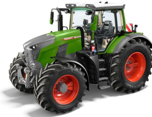
Bild 3: Mit den neuen 800er (Gen5) füllt Fendt die Lücke zwischen 700er und 900er Fig. 3: With the new 800 series, Fendt fills the gap between the 700 and 900 series

In den 1000er-Modellen kommt weiterhin der 6-Zylinder-Motor D26 von MAN mit 12,4 l Hubraum zur Anwendung, alle verfügen neu aber über Dynamic Performance (DP) mit bis zu 22 kW (30 PS) Mehrleistung. Das Topmodell 1052 kommt damit auf eine Maximalleistung von 404 kW (550 PS). Weil nicht alle Anbaugeräte auf so hohe Leistungen ausgelegt sind, bietet Fendt die Funktion „AdaptivePower“ an, mit der sich bei den größeren Modellen auch die Leistungsstufen der darunterliegenden auswählen lassen.