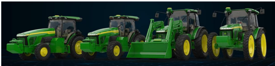
Bild 2: Geplante E-Power-Modellpalette von John Deere

John Deere präsentierte zur Agritechnica einen E-Power-Prototyp. Dieser basiert auf einer Plattform, die wie bei Rigitrac, ZSHX, ONOX und TADUS von Grund auf für die batterieelektrische Antriebstechnik ausgelegt wurde ("Purpose Design"). Mit der rein elektrischen „By-wire“-Ansteuerung von Lenkung und Bremsen sowie speziellen Kamera- und LiDAR-Systemen berücksichtigte John Deere zudem von Beginn weg das autonome Fahren.