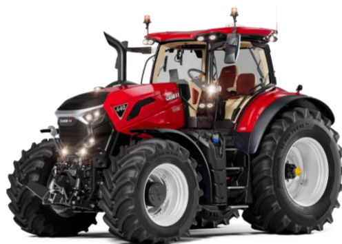
Bild 5: Case IH Optum 440 als Vertreter der neuen Großtraktoren von CNH

Auch CNH stellte mit den Baureihen Case IH Optum 360-440, New Holland T7 XD und Steyr Cervus neue Großtraktoren vor, Bild 5 . Angetrieben werden auch diese vom FPT-Motor Cursor 9. Die Nennleistungen nach ECE-R120 liegen bei 265/287/320 kW (360/390/435 PS), auf Über- und Boostleistungen wird verzichtet. Die in Europa entwickelten und gebauten Modelle spielen damit in der gleichen Liga wie die amerikanischen Pendanten (Magnum und T8), die vorerst im Programm bleiben. Mit den Neuen sind Fahrgeschwindigkeiten von 40, 50 und 60 km/h bei reduzierten Motordrehzahlen möglich. Weitere Informationen zu Motor und Stufenlosgetriebe sind im Kapitel "Motoren und Getriebe" zu finden. Für die Heckzapfwelle stehen die Optionen 540E/1000 und 1000/1000E zur Verfügung, für die Frontzapfwelle 1000/1000E. Das maximal zulässige Gesamtgewicht liegt bei 19 t (gültig bis 50 km/h), der Radstand bei 3.19 m. Für die Vorderräder gibt es neu eine gefederte Einzelradaufhängung und im Mittelteil verbaute Vollscheibenbremsen. Ab Werk angeboten wird eine integrierte Reifendruckverstellanlage für beide Achsen mitsamt 2-Zylinder-Kompressor.