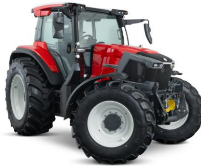
Bild 7: Lintrac 160 LDrive mit gelenkter Hinterachse und N45-Motor von FPT

und erlaubt 50 km/h bereits bei einer Motordrehzahl von 1667 min -1 . Das Heckzapfwellengetriebe bietet vier Drehzahlen (540/540E/1000/1000E), die Pendel-Vorderachse mit Doppelquerlenker-Federung kommt von Carraro. Die neue, größere Kabine ist pneumatisch gefedert und weist u.a. eine beheizbare Frontscheibe und eine komplett überarbeitete Bedienarmlehne auf. Für Arbeiten mit Frontlader gibt es den SmartLift-Modus, mit welchem u.a. die Lenkübersetzung und die Getriebesteuerung angepasst werden kann.