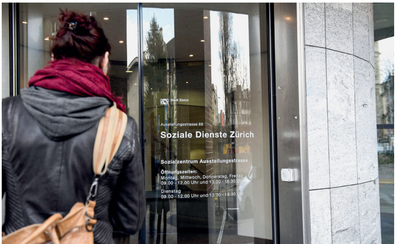
Die Meinungen zur Attraktivität der Sozialhilfe als Arbeitsfeld gehen sehr stark auseinander.

Zur Ermittlung der Attraktivität verschiedener Arbeitsfelder gaben 266 Studienabgänger auf einer Skala von 1 («sehr unwahrscheinlich») bis 5 («sehr wahrscheinlich») die Wahrscheinlichkeit an, mit der sie sich