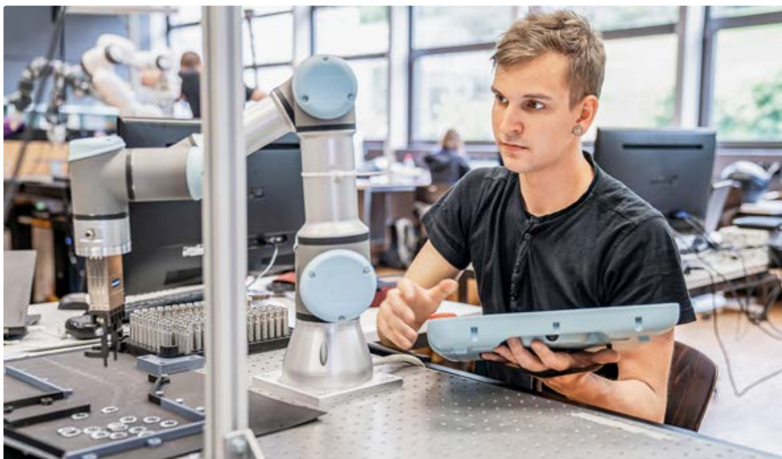
Auto-Mate Robotics > Roboter programmieren leicht gemacht.

dem Roboter auch komplexere Befehle zu erteilen wie «Ergreif Objekt», «Platziere Objekt in Pallett», «Wiederhole Vorgang, bis Pallett voll ist». Die einzelnen Parameter – etwa die Abmessungen des Objekts oder seine Oberflächenbeschaffenheit – können jederzeit angepasst werden. So lässt sich das System rasch für wechselnde Aufgaben programmieren. Entscheidend ist, dass für das Programmieren der Aufgabe nicht eine schwer erlernbare Programmiersprache nötig ist. An ihrer Stelle kann man die vertraute Sprache benutzen und auch auf intuitiv anwendbare Hilfsmittel wie Kameras zurückgreifen. Diese Vereinfachung kann mit der Einführung der grafischen Benutzeroberfläche für Computer in den 1980er-Jahren verglichen werden. Anstatt eine Aktion mit der Eingabe eines MS-DOS-Befehls auszulösen, genügt von da an ein Mausklick auf ein Symbol. Hinter dem Symbol verbarg sich allerdings weiterhin ein Befehl in einer komplexen Programmiersprache.