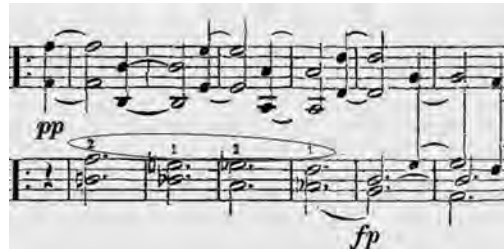
ABBILDUNG 4 Liszt-Ausgabe, Takt 45–50

dieser Bassquarten gegeben habe, nämlich 5-2/4-1/5-2/4-1. 34 Dieser Fingersatz ist auch in der sonst so sparsam bezeichneten Liszt-Ausgabe angegeben, indem über den Doppelfingern 2/1/2/1 notiert ist, was keine andere sinnvolle Fingerkombination zulässt als die ausführlich von Lenz beschriebene. Auch Bülow gibt hier einen Fingersatz an, allerdings konzentriert er sich offensichtlich auf die Bindung der unteren Leitstimme und lässt den Daumen nur mitrutschen: 2-1/3-1/4-1/5-1. Er hat also die Gleichwertigkeit der zwei ›Cello‹ weniger im Auge als Liszt.