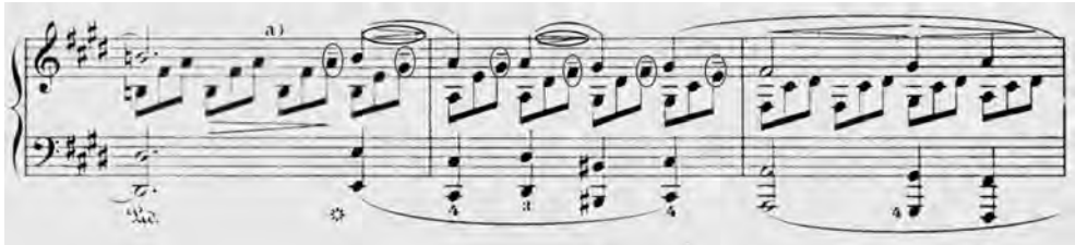
ABBILDUNG 2 Beethoven: Sonate cis-Moll op. 27 Nr. 2, Bülow-Ausgabe, Takt 56–58

In einer Interpretationsanweisung gegen Ende des ersten Satzes zeigt sich Bülow's Neigung zur lehrreichen »Vivisektion« der Musik besonders deutlich: