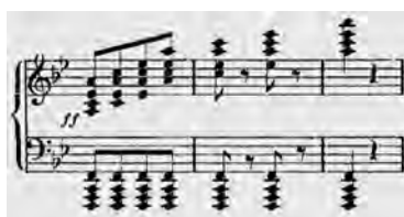
ABBILDUNG 8 Hans von Bülows Überleitung von der Sonate op. 101 zur Hammerklaviersonate

Hans von Bülow als Advokat der Hammerklaviersonate Hans von Bülow setzte sich wie Liszt sehr für die Einführung der Hammerklaviersonate beim Publikum ein. Er spielte sie oft sogar zweimal hintereinander, um den Zuhörerinnen und Zuhörern die Möglichkeit zu geben, das komplexe Stück besser zu verstehen – eine wahre Tour de force für beide Seiten. 35 Auch für Aufführungen dieser Sonate ist seine Praxis des Präludierens belegt – so leitete er sie im Jahr 1879 beispielsweise mit einem Fragment der stimmungsverwandten Sonate op. 22 ein 36 oder spielte zwischen Aufführungen der Sonate op. 101 und der Hammerklaviersonate Folgendes: 37