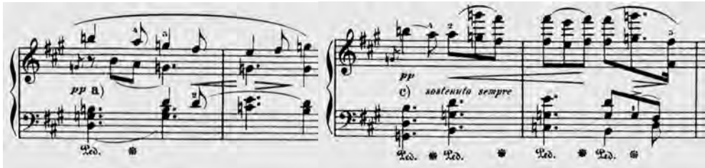
ABBILDUNG 10 Bülow-Ausgabe, Takt 14/15 und 22/23

Zu der berühmten Kontraststelle in G-Dur gibt Bülow zwei Instruktionen, die exemplarisch für seine Editionsästhetik sind: