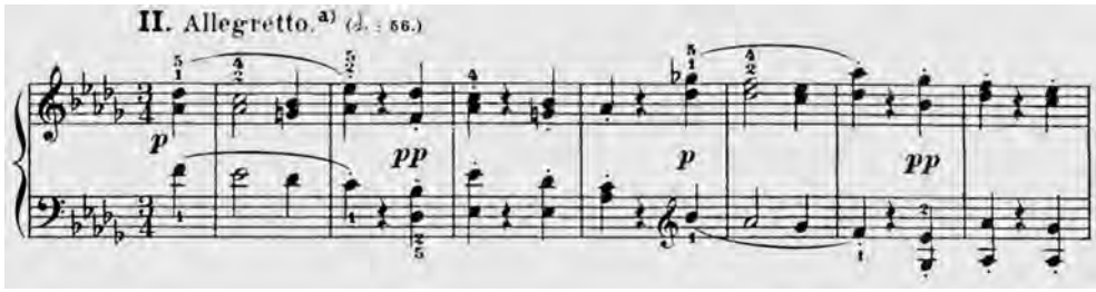
ABBILDUNG 3 Bülow-Ausgabe, Takt 1–7