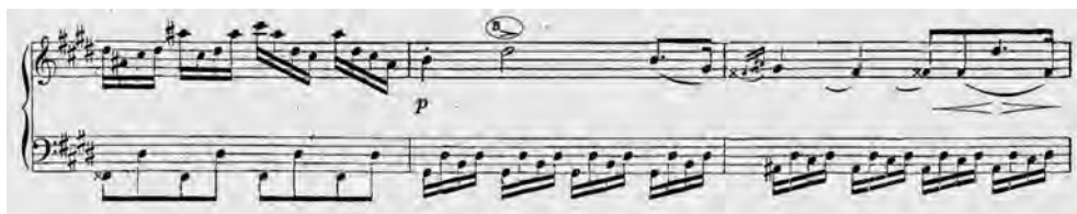
ABBILDUNG 5 Liszt-Ausgabe, 3. Satz, Takt 20–22

Gliederungsbuchstaben spezifisch über der zweiten Viertel im Takt, denn die erste gehört noch als Abschluss zur vorherigen Passage: