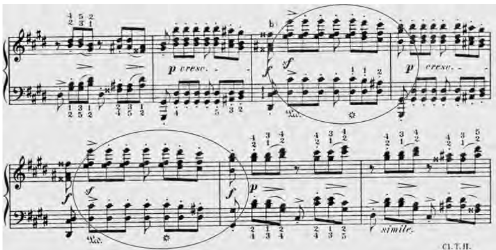
ABBILDUNG 7 Bülow-Ausgabe, Takt 48–54

Bülow schreibt zur späteren Variation des erwähnten Staccato-Motivs im Forte, dass ein Herunterhämmern dieser »leidenschaftlichen« Akkorde streng im Tempo ästhetisch offensichtlich falsch sei. Er empfiehlt stattdessen, die mit einem Sforzato beginnenden Takte (Takt 50 beziehungsweise 52) jeweils mit stärkerer Betonung und größerer Freiheit auszuspielen – auch um die rhythmische Wichtigkeit der zweiten Achtel herauszustellen – während die beiden Piano-Takte danach wieder zu beschleunigen seien: