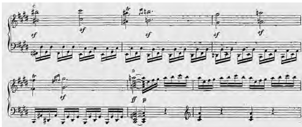
ABBILDUNG 6 Liszt-Ausgabe, Takt 29–34

Ein Beispiel für eine weitere kurze und daher strukturell besonders bedeutungsvolle Passage in Liszts Gliederung folgt bald darauf: