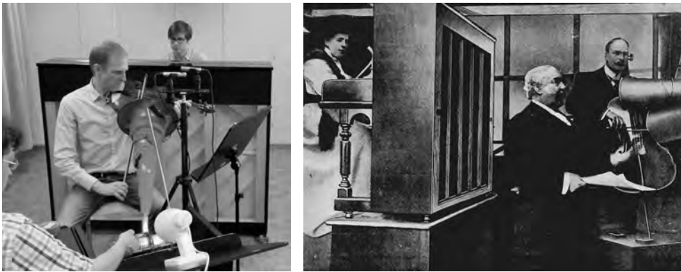
ABBILDUNG 3 Reenactment einer historischen Aufnahmesituation von 1903 (Abbildung aus einer undatierten Annonce der Gramophone Company, um 1904) am Beispiel von Joseph Joachims Romanze an der НКВ 2015

füßbar sind (historische Musikinstrumente, Instruktionen zu ihrer Handhabung sowie Annotationen im Aufführungsmaterial), ist die methodische Parallele zu den Experimentalsystemen der retrospektiv arbeitenden experimentellen Archäologie beziehungsweise der Kriminalistik – mithin die Methodenübertragung – offensichtlich.