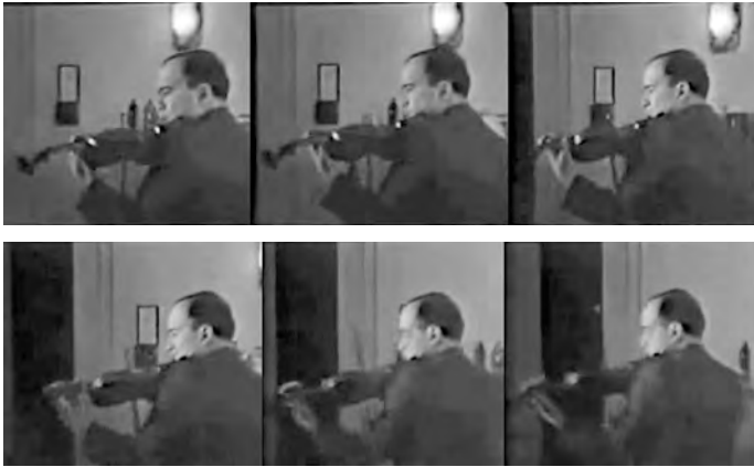
ABBILDUNG 4 Bronislaw Huberman (1882–1947) beim Einspielen, privater Stummfilm, Cincinnati/Ohio 1929 www.youtube.com/watch?v=oOWpp_wrsFM (zuletzt aufgerufen am 31. Januar 2018)

eine stabilisierende Funktion hatte. Dieses auf den ersten Blick rein technische Detail wirkt sich auf eine größere Bereitschaft zu hörbaren Lagenwechseln (Portamento) aus und zeigt, wie bei einer historischen Violinhaltung mit freierem Kinn die Bogenführung und damit die Klangwirkung so modifiziert werden, dass sie in den Details der Interpretationsanalyse ihre haptische Entsprechung finden – und im Interpretationsexperiment körperlich nachvollzogen werden können.