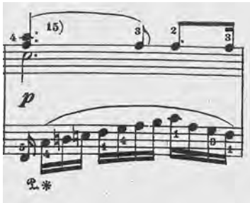
ABBILDUNG 8 Zwei- oder dreistimmig? Erster Satz, Takt 44–47, Ausgabe Goldenweiser

führung beschäftigt er sich sowieso ziemlich ausführlich. Dabei betont er die zwei Ebenen, mit dem Thema in der rechten Hand und der melismatischen Begleitung. Allerdings macht er geltend, dass die Sache so einfach nun auch wieder nicht ist, da die linke Hand keineswegs bloß einstimmig sei (Abbildung 8). 19