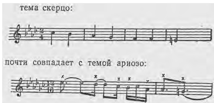
ABBILDUNG 4 Anlage des Scherzothemas im thematischen Material des Arioso, Ausgabe Goldenweiser

Sonate als Ganzes, die Großform. Dazu gehören auch thematische Querverbindungen zwischen den Sätzen, die er quasi als Geheimcode für die ganze Sonate hervorhebt. So weist er im Fall der Sonate op. 110 – ich habe mich hier auf jenes Stück beschränkt, das ich selbst als Pianist bereits fast dreißig Jahre im Repertoire habe und das zu einer Art ständigem Begleiter geworden ist – auf das Fugenthema des dritten Satzes hin, das er bereits im ersten Satz angedeutet sieht und deshalb mit Kreuzen markiert (Abbildung 3). Ebenso sieht er die fallenden Linien des Scherzos als thematisches Material des Arioso (Abbildung 4) vorhanden. 11 Dazu kann es verschiedene Meinungen geben, dennoch erscheint mir bemerkenswert, wie er die großen Linien betont. Das geht auch über das einzelne Werk hinaus. So zieht er etwa von der Sonate op. 110 die Parallele zur ersten Sonata quasi una fantasia Es-Dur op. 27 Nr. 1, die gewisse formale Ähnlichkeiten aufweist: der eröffnende Sonatensatz, eine Art Scherzo in der Mollparallele an zweiter Stelle, der komplexe dritte Satz mit langsamer Einleitung und einem Allegro, das von der Coda durch eine Wiederaufnahme des langsamen Teils getrennt ist. Gleichzeitig betont er aber auch, dass die Sonate op. 110 natürlich viel komplexer und größer angelegt ist als die zwanzig Jahre zuvor entstandene Sonata quasi una fantasia. 12