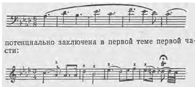
ABBILDUNG 3 Anlage des Fugenthemas im Hauptthema des ersten Satzes, Ausgabe Goldenweiser