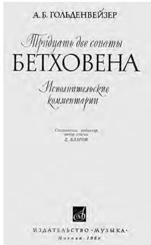
ABBILDUNG 2 Titelseite von Goldenweisers Kommentarband zu den Beethoven-Sonaten

stehen, der den Ausgangspunkt der Interpretation bildet und zum Leben erweckt werden muss. Dabei soll der Text nicht zur Selbstdarstellung missbraucht werden: Man muss die eigenen Ideen in den Dienst am musikalischen Text stellen, nicht umgekehrt. Dies ist das oberste Gebot von Goldenweiser, auch im Hinblick auf die Redaktion seiner Ausgabe. Damit verneint er keinesfalls die Individualität einer Interpretation, die aus der Verbindung von persönlicher Auffassung und musikalischem Notentext entsteht, stellt letzteren aber an erste Stelle. Seine Herangehensweise beginnt zudem mit dem Gesamtwerk und richtet den Blick dann in zweiter Linie auf Details, nicht umgekehrt. Anscheinend war dies laut Braginski im Unterricht nicht anders: zunächst sprach er über eine