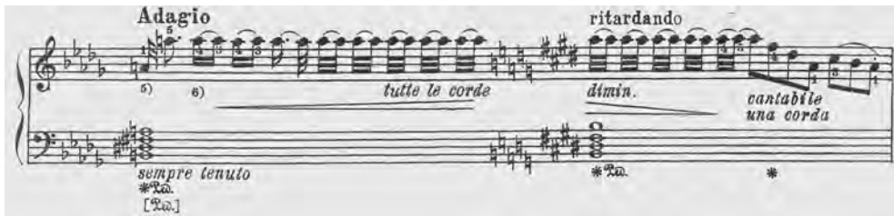
ABBILDUNG 7 Pedalisierung im Adagio ma non troppo, Takt 5, mit Originalangaben und eigenen Vorschlägen, Ausgabe Goldenweiser, S. 182

Urtext-Ausgaben geteilter Meinung sein, immerhin scheint es mir lobenswerter zu sein als das Vorgehen von Paderewski, Bronarski und Turczyński, die in der ersten Chopin-Gesamtausgabe ziemlich willkürlich vorgingen, wenn sie ein Pedal als unpassend oder für den modernen Flügel als falsch befanden. 18 Erst mit der neuen Urtext-Ausgabe sind die originalen Pedalisierungen von Chopin wieder greifbar – und mit ein wenig Geschick lassen sie sich durchaus auch auf dem modernen Flügel umsetzen, wobei sich ganz andere Klangeffekte ergeben als bei den Vorschlägen von Paderewski und seinen Mitarbeitern.