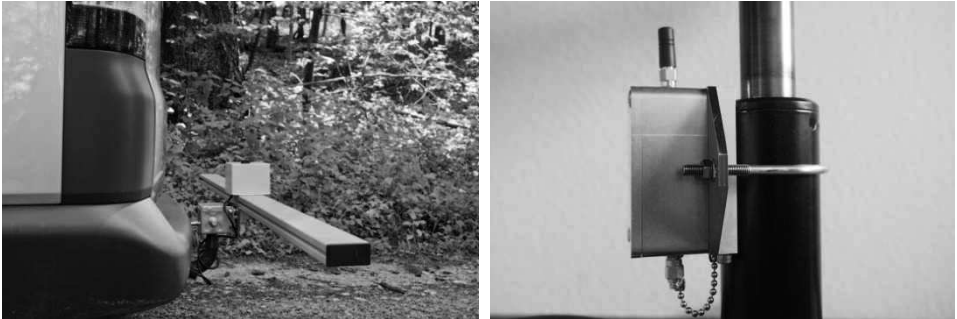
Abbildung 2 (links): Messlanze, montiert an der Anhängerkupplung eines Trägerfahrzeugs (R. Baula); Abbildung 3 (rechts): Beschleunigungssensor mit Antenne und Akku (D. Rommel)

Die Windows-basierte Auswertsoftware bereitet den gelieferten Datensatz (live oder zeitversetzt) so auf, dass eine Zuordnung der Straßenzustandsparameter auf die vom Nutzer frei definierbare Straßenkategorien erfolgt und dass die Daten in einem Geoinformationssystem (GIS) analysiert und dargestellt werden können [Zi14].