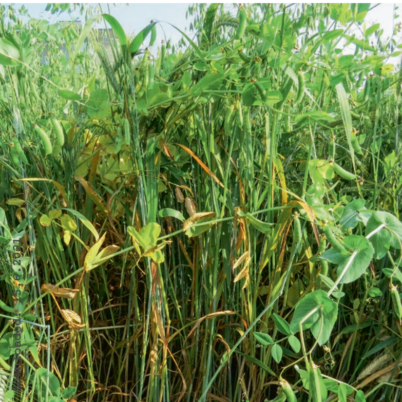
Triticale-Hafer-Erbsen-Mischung zum Zeitpunkt der Ernte.

Auskünfte: Yves Arrigo, E-Mail: yves.arrigo@agroscope.admin.ch