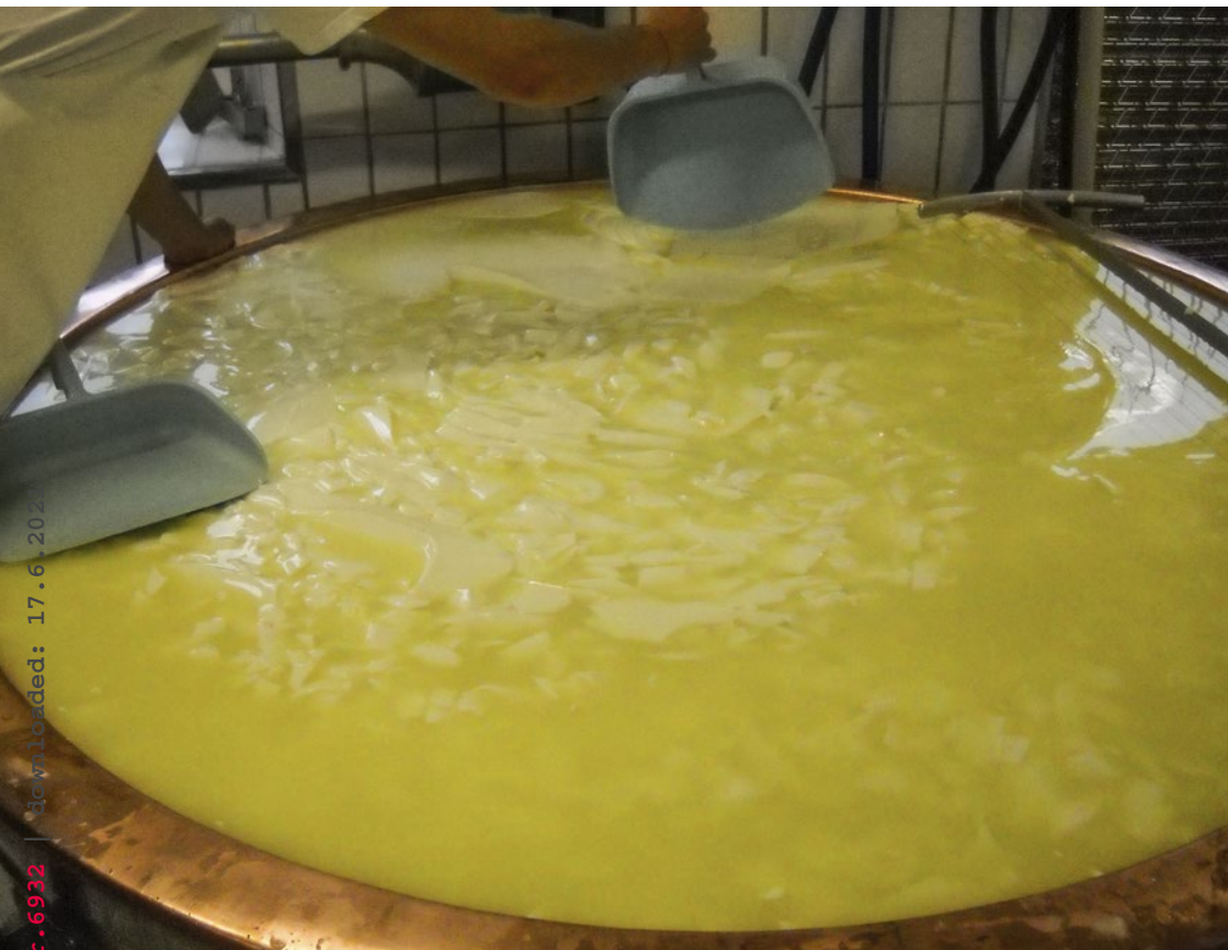
Vacherin mit Molke.