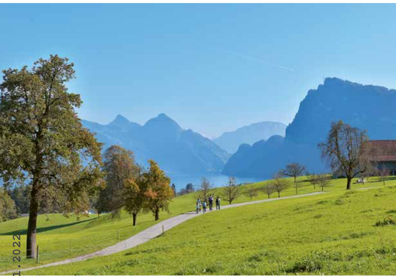
Abb. 1 | Viele attraktive Landschaften gehören zu den Stärken des Tourismusstandortes Schweiz.