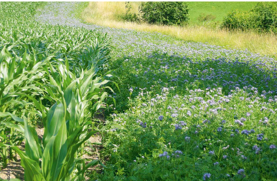
Abb. 1 | Blühende Pflanzen während der trachtarmen Zeit im Sommer sollen Bestäubern und anderen Nützlingen Nahrung bieten: Blühstreifen in der Vollblüte von Phacelia.

Auskünfte: Hans Ramseier, E-Mail: hans.ramseier@bfh.ch