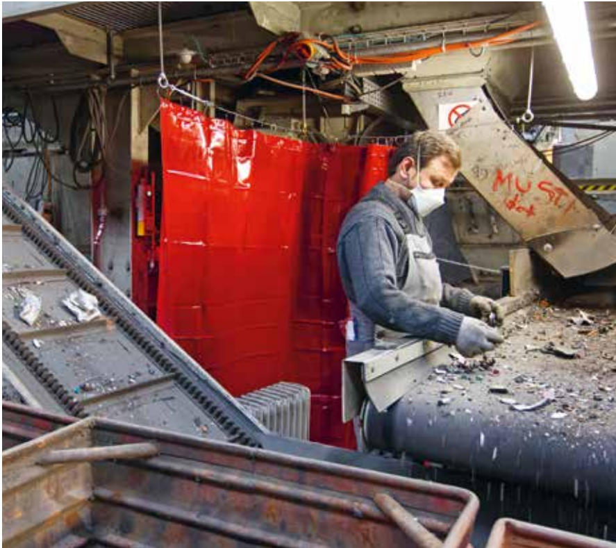
Ein Angestellter einer Schweizer Recyclingfirma sortiert Elektronikschrott.

und Japan) darauf hin, dass Indium aus Flachbildschirmen im industriellen Massstab zurückgewonnen werden kann. Zudem haben erste Ökobilanzen gezeigt: Das Recycling von Indium bei einer manuellen Vorbehandlung (Sekundärproduktion) ist gegenüber der Gewinnung aus Erzen (Primärproduktion) als vorteilhaft oder zumindest als gleichwertig zu beurteilen – unabhängig vom Verfahren der Rückgewinnung. 4