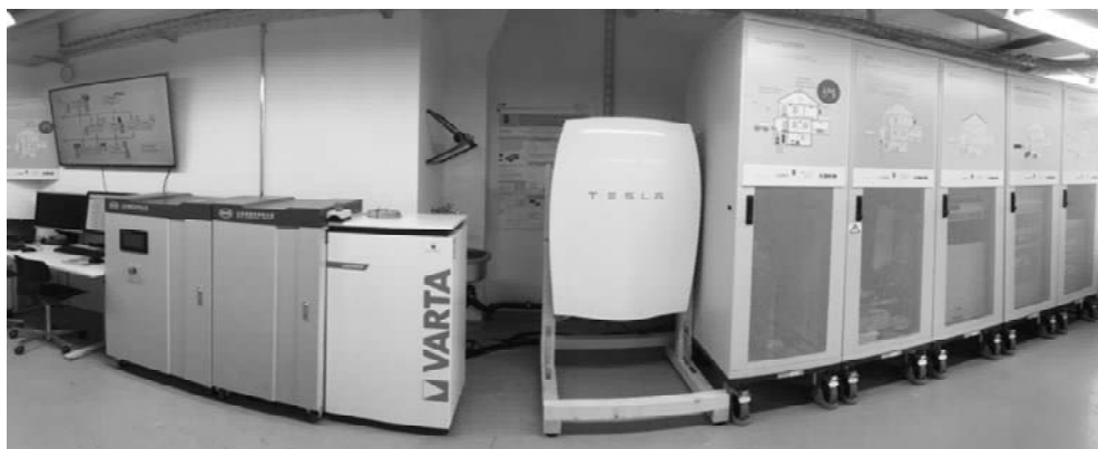
Bild 1: Prosumer-Lab Testumgebung im Labor des BFH-CSEM-Zentrums Energiespeicherung

Um realitätsnah die Stromflüsse im smarten Gebäude und deren Einfluss auf das Niederspannungsnetz zu untersuchen und zu verbessern, wurde ein intelligentes Gebäude im Labor modular aufgebaut. Damit wird es möglich, reelle Stromflüsse eines Ein- oder Mehrfamilienhauses mit Photovoltaikanlage, Stromspeicher und Verbrauchern nachzubilden. Die Reproduzierbarkeit der Testszenarien ist dabei das wesentliche Element des Prosumer-Labs: Erst so wird es möglich EMS, Energiespeicher oder andere Geräte 1:1 zu vergleichen oder zu optimieren.