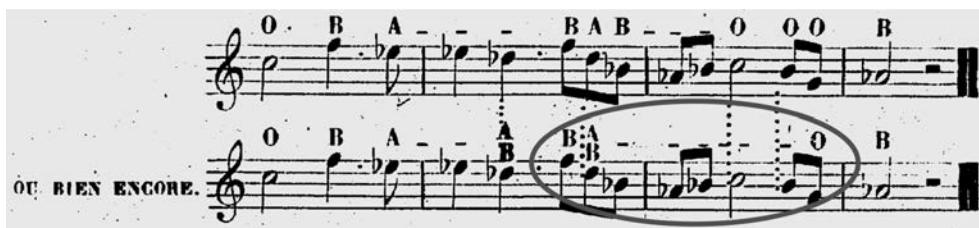
ABBILDUNG 1 Hinweis auf eine überhastete Drucklegung sind die Fehler in Gounods Méthode de cor à pistons ; hier Seite 5: A bezeichnet das Halb-, B das Ganztonventil; es fehlt ein Buchstabe B nach der Kombination AB.

richtete und so seinem Kollegen nicht hineinfuschen wollte. Unverständlich beziehungsweise überdeutlich in der Ablehnung bleibt das Schweigen dagegen bei Mohr, besonders wenn man bedenkt, dass er 1864 zwar die Nachfolge von Gallay antrat, gleichzeitig aber die Ventilhornklasse Meifreds mit dessen Pensionierung wieder aufgelöst wurde. Erst Mohrs Nachfolger François Brémond, der die Hornklasse 1891 übernahm, interessierte sich wieder vermehrt für das Ventilinstrument. So gab er neben umfassenden Exercices journalières (täglichen Übungen) für Ventilhorn beispielsweise auch die Schule von Dauprat in einer für das Ventilinstrument überarbeiteten Version heraus und erreichte schließlich auch die Wiedereinführung der Ventilhornklasse am Conservatoire. Bereits vor der offiziellen Einführung 1903 veranstaltete er im Übrigen eine wöchentliche inoffizielle Klassenstunde mit dem Ventilinstrument. 20 Brémond setzt sich der von ihm herausgegebenen Méthode stark für parallele Studien mit beiden Instrumenten ein, so schreibt er im Vorwort: