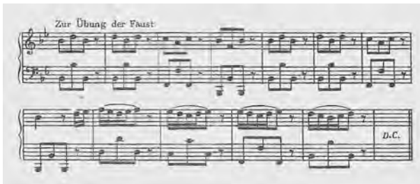
FIGURE 2 « Zur Uebung der Faust », d'après les esquisses de Beethoven. Beethoven Skizzenheft, dans : Johann Baptist Cramer: 21 Etüden für Klavier nach dem Handexemplar Beethovens aus dem Besitz Anton Schindlers, éd. par Hans Kann, Vienne 1974, p. XI

Ce mouvement, d'origine certainement plus ancienne, semble figurer dans l'un des rares écrits de pédagogie pianistique de Beethoven : dans le cahier d'esquisses de ce compositeur, on trouve l'indication « Zur Uebung der Faust » (Figure 2).