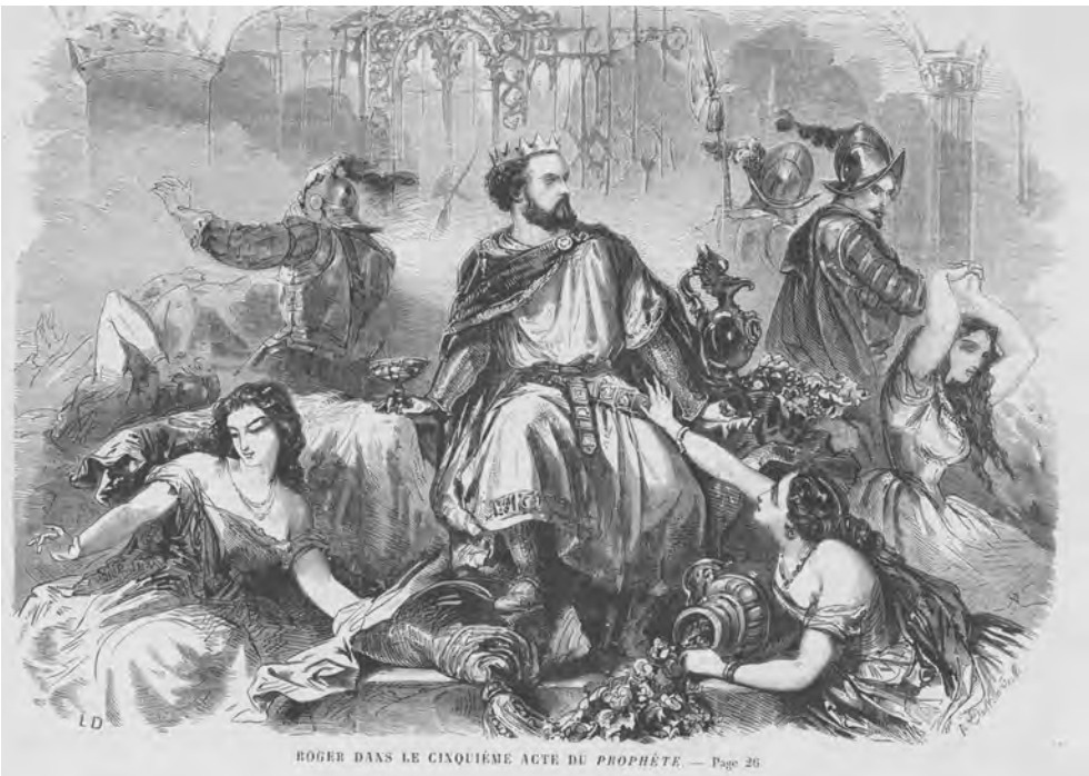
ABBILDUNG 12 A. De Neuville: Roger dans le cinquième acte du Prophète, in: L'univers illustré, 1859