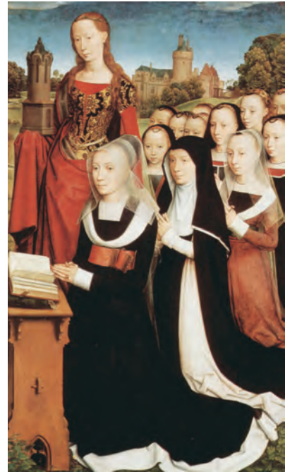
ABBILDUNG 5 Edward Henry Corbould: The Coronation Scene from Meyerbeer's Le Prophète , 1850, Victoria and Albert Museum, London (oben) ABBILDUNG 6 Hans Memling: Triptychon der Familie Moreel, rechter Außenflügel, 1484, Groeningen Museum, Bruges (rechts) ABBILDUNG 7 Hans Holbein der Jüngere: Die Gesandten, 1533, National Gallery of Art, London (unten)