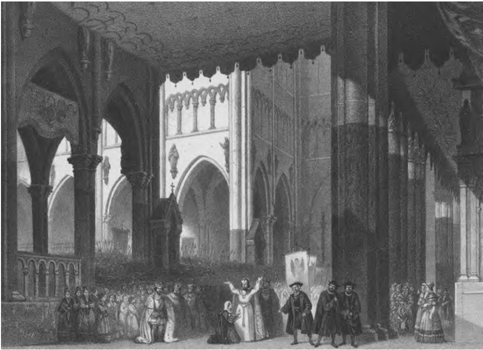
ABBILDUNG 3 Profeta, Atto IV, Scena IV, in: Album scenografico , 1854

zeitgleichen Malerei zu vergleichen. Diese synästhetische Verweispraxis ist ein gängiger Interpretationsmodus der Zeit. Anstatt mit Worten den Eindruck einer Oper zu umschreiben, werden einfach die Titel berühmter Gemälde oder die Namen großer Künstler zitiert. Solche ikonografischen Verweise finden sich in der Besprechung der Erstaufführung von Le Prophète , die Théophile Gautier am 23. April 1849 in La Presse veröffentlicht hat, gleich mehrfach. Zur Interpretin der Fidès , zu Pauline Viardot-García, heißt es hier, dass sie ihre Rollengestaltung mit viel Kunst und Gefühl im Ausdruck gemeistert habe. Schließlich sei sie in ihrer äußeren Erscheinung, in ihrer Aufmachung und im Kostüm wie eine Kopie nach porträtierten Frauen altniederländischer Maler dahergekommen: