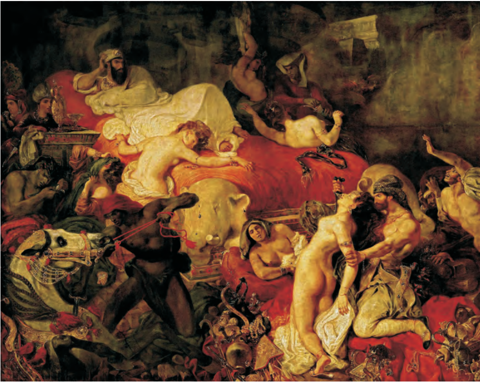
ABBILDUNG 11 Eugène Delacroix: Der Tod des Sardanapal, 1827, Musée du Louvre, Paris