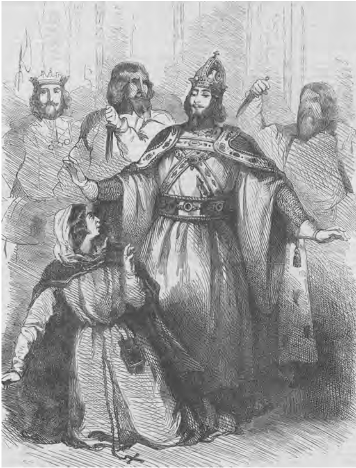
ABBILDUNG 2 J. Gauchard: Théâtre de l'Opéra. Reprise du Prophète, acte 4 e , scène dernière, M. Roger et madame Viardot, in: L'illustration, 3. November 1849, S. 156

Historienmalerei erklären, zu deren Aufgaben es unter anderem gehörte, das dargestellte Geschehen möglichst lebendig und wirkungsstark zu vermitteln. Die direkte Konfrontation mit dem Leidenszustand der an vorderster Front gezeigten Figuren wie in Corboulds Gemälde ermöglicht eine solche emotionale Einbindung des Betrachters. Was hingegen die Gruppierung der Figuren und die Gestaltung ihrer Körperhaltungen angeht, so ist das exemplarische Kompositionsmuster, wie es die grafischen Opernillustrationen reihenweise wiedergeben, unverkennbar. Allein an diesem Beispiel wird ersichtlich, auf welche Art sich Konventionen der Darstellung herausgebildet haben. Die damalige visuelle Rezeption der Opern zeichnet sich durch die Ausbildung von stereotypen Darstellungen aus, die sich zu einer Art ikonischen Allgemeinplätzen verfestigt haben. Als solche wurden sie Teil eines kollektiven Bildgedächtnisses, welches bis heute unser Verständnis einer vergangenen Opernrealität prägt.