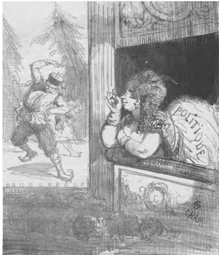
ABBILDUNG 10 Cham (Amédée Charles de Noé, dit): La politique allant voir le ballet du prophète pour tacher elle aussi de marcher sur des roulettes, in: Actualités Nr. 157, 1869