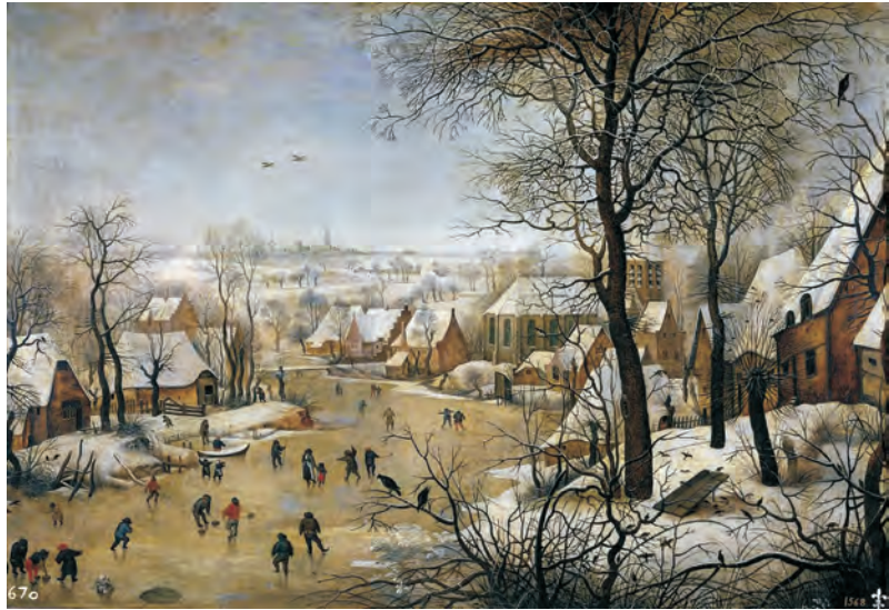
ABBILDUNG 9 Pieter Brueghel der Jüngere: Winterlandschaft mit Eisläufern und einer Vogelfalle, um 1601, Prado, Madrid