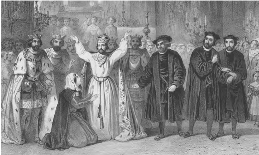
ABBILDUNG 8 Le Prophète , Lithographie, hg. von Simonau & Toovey, Paris, 1849

profond de l'Allemagne au moyen âge, semble une immense fresque dessinée et peinte par l'un de ces maîtres suprêmes.« 2