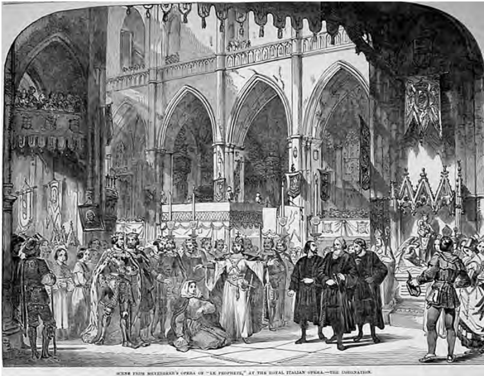
ABBILDUNG 4 Scene from Meyerbeer's opera »le Prophète«, at the Royal Italian Opera, The Coronation, in: The Illustrated London News , 28. Juli 1849, S. 56

Bruges konfrontiert wird. Ein Gemälde, das Gautiers Vorstellung geprägt haben dürfte – auch ohne, dass er sich im Detail daran erinnern muss –, könnte der rechte Außenflügel von Hans Memlings Devotionstryptichon gewesen sein. Gezeigt wird die Ehefrau des Stifters Willem Moreel, Barbara van Vlaenderberch, mit ihren elf Töchtern, die vor ihrer Schutzpatronin, der Heiligen Barbara, knien und beten. Die Porträtierung dieser Stifterfiguren dürfte Gautier zum Vergleich zwischen der äußeren Erscheinung von Viardot-García als Fidès und der niederländischen Malerei angeregt haben (Abbildung 6).